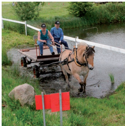
Vandgraven skal også forceres

Alt i alt en overraskende oplevelse, og jeg kan kun anbefale andre at tage ud og se disse stævner, måske endnu bedre at deltage i dem. Det er desværre en lidt overset konkurrence, men det kræver bestemt også meget træning. Det ville faktisk være en god idé, hvis alle vore heste kunne disse