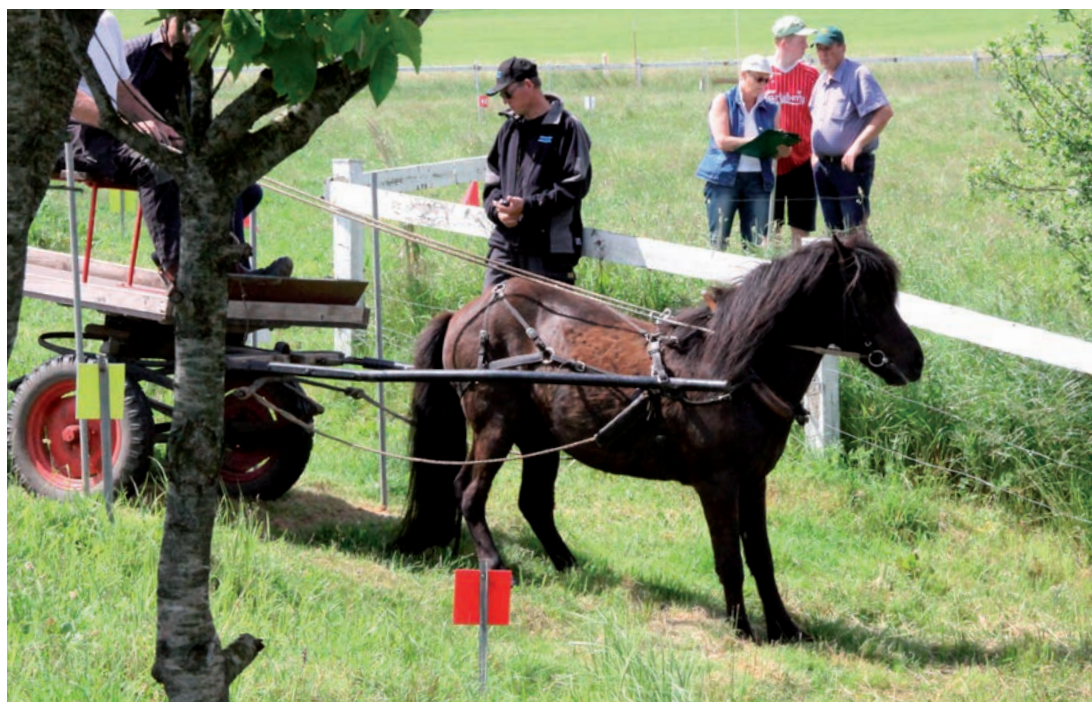
Der skal en stabil hest til at stå stille ned ad bakken

måtte ud at opleve denne gren af sporten, og ja, jeg må indrømme, at jeg blev noget overrasket. Det er en disciplin, man ikke hører ret meget til, men hold da op, hvor er den svær.