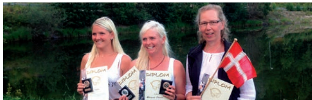
Vinderne i hest-klassen