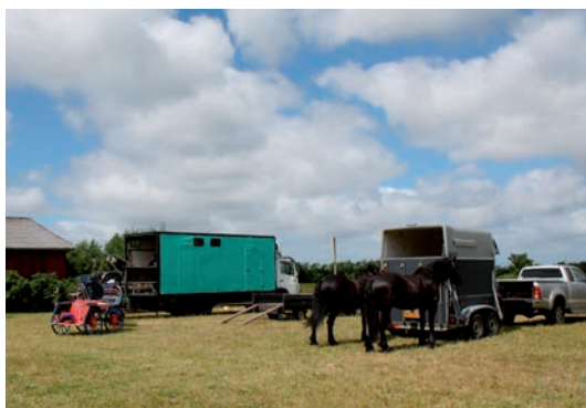
Så er der ved at blive gjort klar

for alle. Det var længe siden, vejene var blevet planet, så der var nogle gode bump på vejen, men samtidig en unik naturoplevelse.