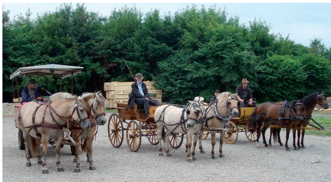
Flotte ekvipager i Randbøl Hede

Vil forhåbentlig være afholdt, når bladet udkommer.