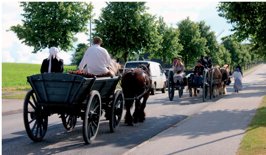
Klar til start