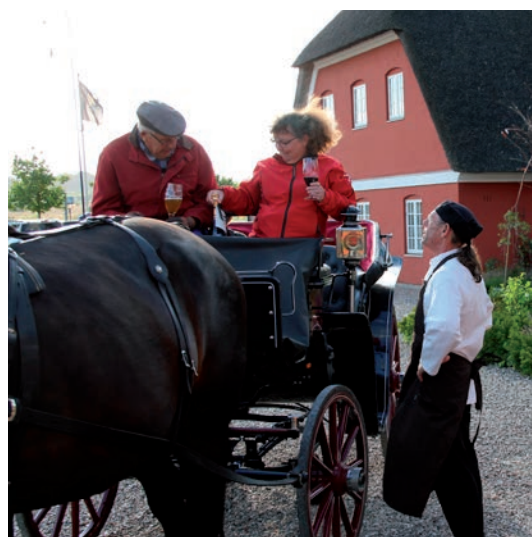
Beværtningen fejlede ikke noget