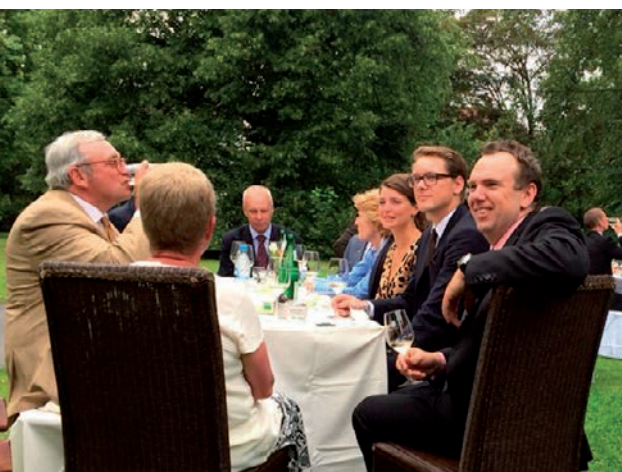
Kaffebord ved museet