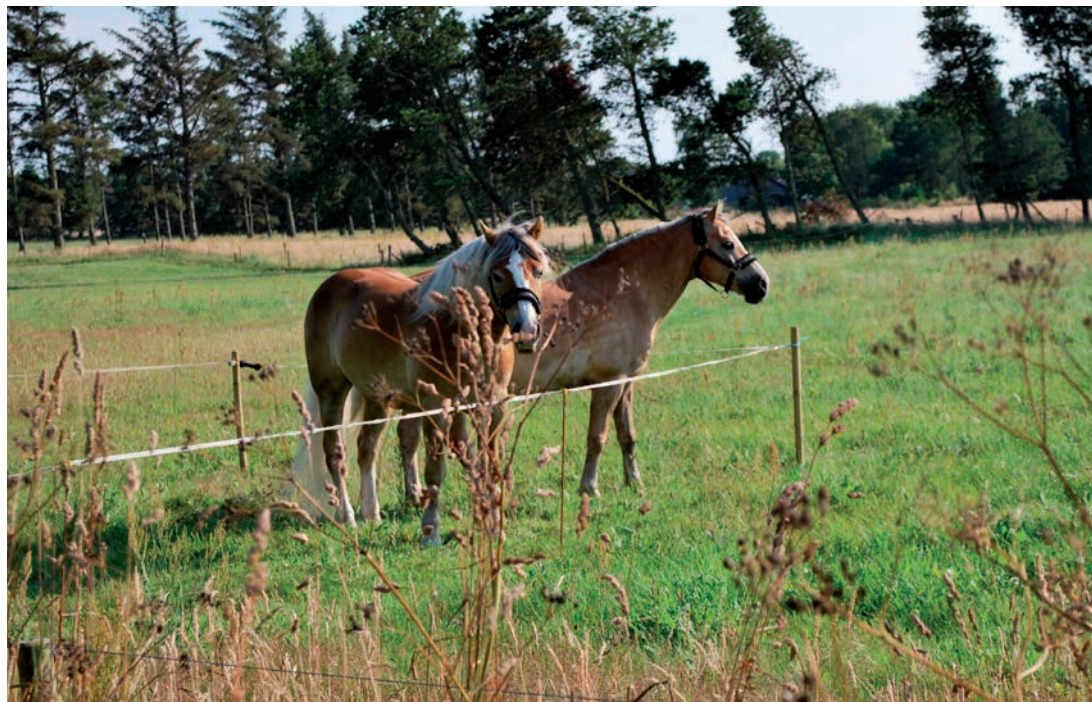
Ferie i Østerild

Denne weekend var så vellykket, at vi kan håbe på, at den kan gentages næste år.