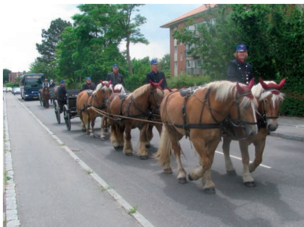
Det giver hurtigt kø i byen

Den type kanon, vi kørte med, hører til det såkaldte Fibiger system. Det blev brugt af den danske hær under de Slesvigske krige. Selve kanonløbet ligger på en feltlavet. Feltlavetten trækkes af en forstilling, hvor hesten er spændt for. Hestene køres fra sadlen af tre kuske. Alle skagler er gennemløbende, således at hvis en hest falder, kan den skæres fri, og de øvrige kan fortsætte. To heste kan sagtens trække kanonen på flad vej, men det har været nødvendigt at have ekstra kapacitet, når terrænet har været vanskeligt eller hestene trætte eller sårede. Når kanonen