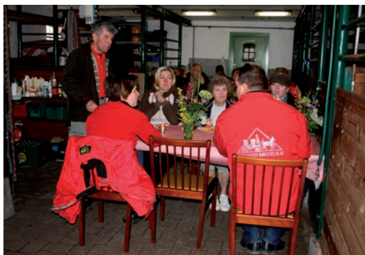
Morgenkaffen var klar, da vi kom