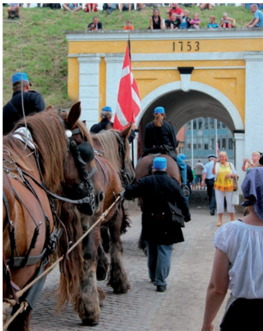
På vej ind i Fredericia

Søndagen startede hårdt ud med 27 kanonskud. Vi var advaret, men ingen problemer. Der skal mere til at slå en jyde ud af kurs.