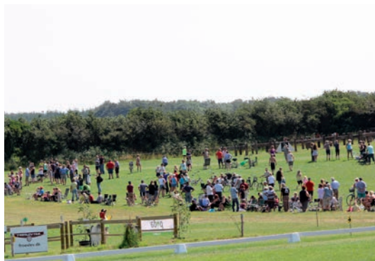
Fantastisk skueplads for publikum

forhindringer stod flot, og det var en fornøjelse for kuskene at køre igennem dem. Ligeledes var de meget publikumsvenlige, idet mange af dem kunne ses et sted fra. Det giver god stemning på pladsen, og kuskene skal ikke køre alene rundt, da der hele tiden er et begejstret publikum.