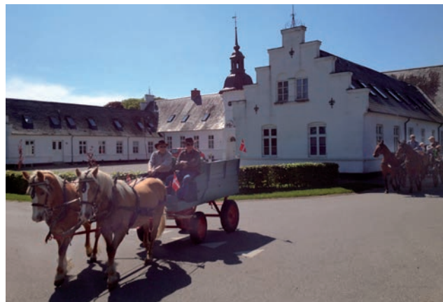
Smukke omgivelser på forårsturen

De 26 deltagere og 6 vogne mødte op på Stationvej 35, Ø. Assels og var, efter lidt forsyninger af kaffe, rundstykker og en lille én, klar til at køre.