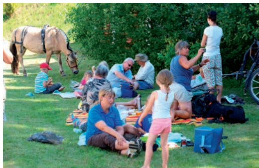
Frokost i det grønne

Dog var det de voksne, der var mest utålmodige og ikke kunne vente på, at bassinet blev fyldt, og derfor begyndte en vandkamp. Efter aftensmaden var der bål, hvor der blev ristet skumfiduser, og der var voksne, som for første gang smagte ristede skumfiduser med marikekiks.