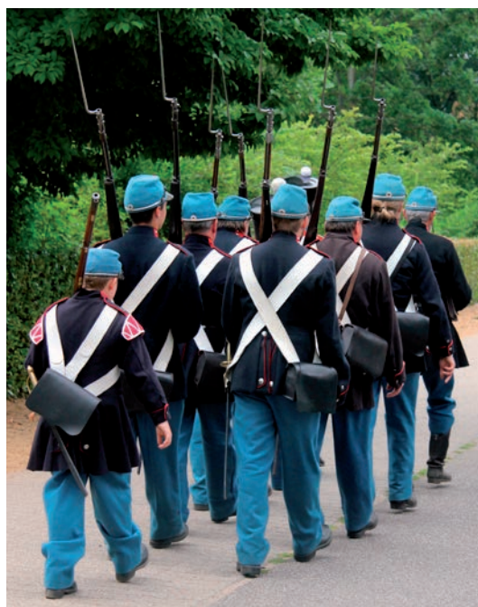
Alle var mobiliseret til krig

Sørgemarchen var ekstrem langsom, og der var da også lavet en anden rute for hestene, men på den første lille kilometer skulle vi følges med resten af optøget, og det var godt nok langsomt selv for en jyde.