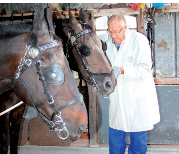
Så er det tid at spænde for

Dernæst gik turen igen gennem den smukke skov, hvorefter næste stop blev Tyrstrup Kro.