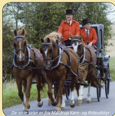
De viste seler er fra Møldrups Køre- og Rideudstyr

Gl. Horsensvej 337, Gjesing, 8660 Skanderborg • Tlf: 86 53 10 11 • www.moldrup-rideudstyr.dk