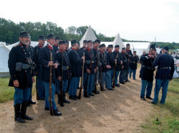
Soldater klar til kamp