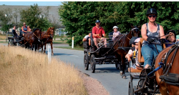
Hyggeligt ser det ud