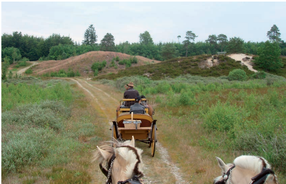
Tur i Randbøl Hedes smukke omgivelser