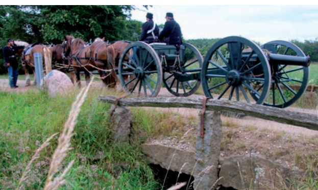
Over den gamle stenbro Fjællebro

På turen ud til Sjølund kom vi forbi kongegegen i Christiansfeld og et gammelt tingsted. På slutningen af turen skulle vi køre ad den meget kønne og historiske vej Fjællebrovej. I omkring 3 km kører man udelukkende på grusvej. Vejen går over den gamle stenbro Fjællebro og over den gamle grænseovergang. Vi havde arrangeret et stævnemøde med en fotograf fra Jydske Vestkysten på dette sted, og han var vældig lykkelig for dette møde.