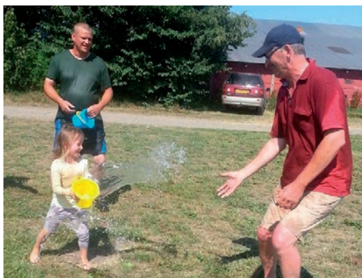
Sommer, varme og vand er ikke kun for børn

Tirsdag var der planlagt en kort tur med start kl. 14.00, så de sidst ankomne kunne være med. Turen gik rundt i Stagsted Skov og Try og var på ca. 10 km. Efter den lille køretur blev badebassinet fundet frem.