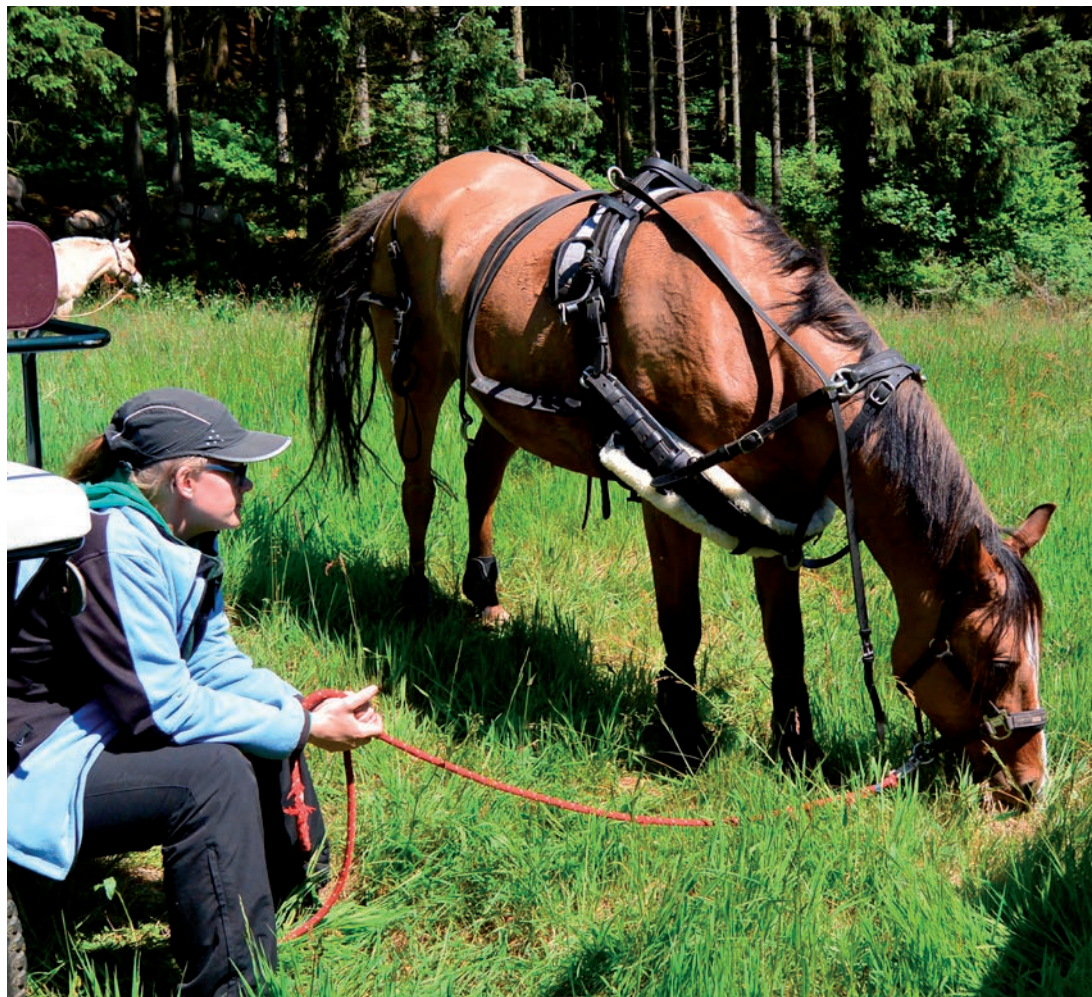
Hvil til både kusk og hest