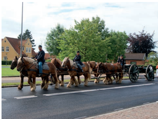
Den sjællandske kanonlavet