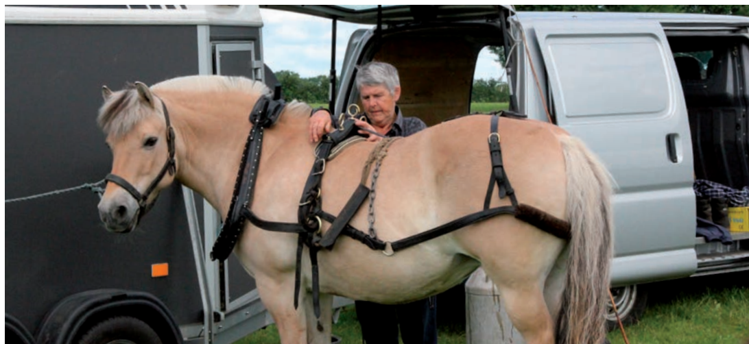
Forspænding kontrolleres også