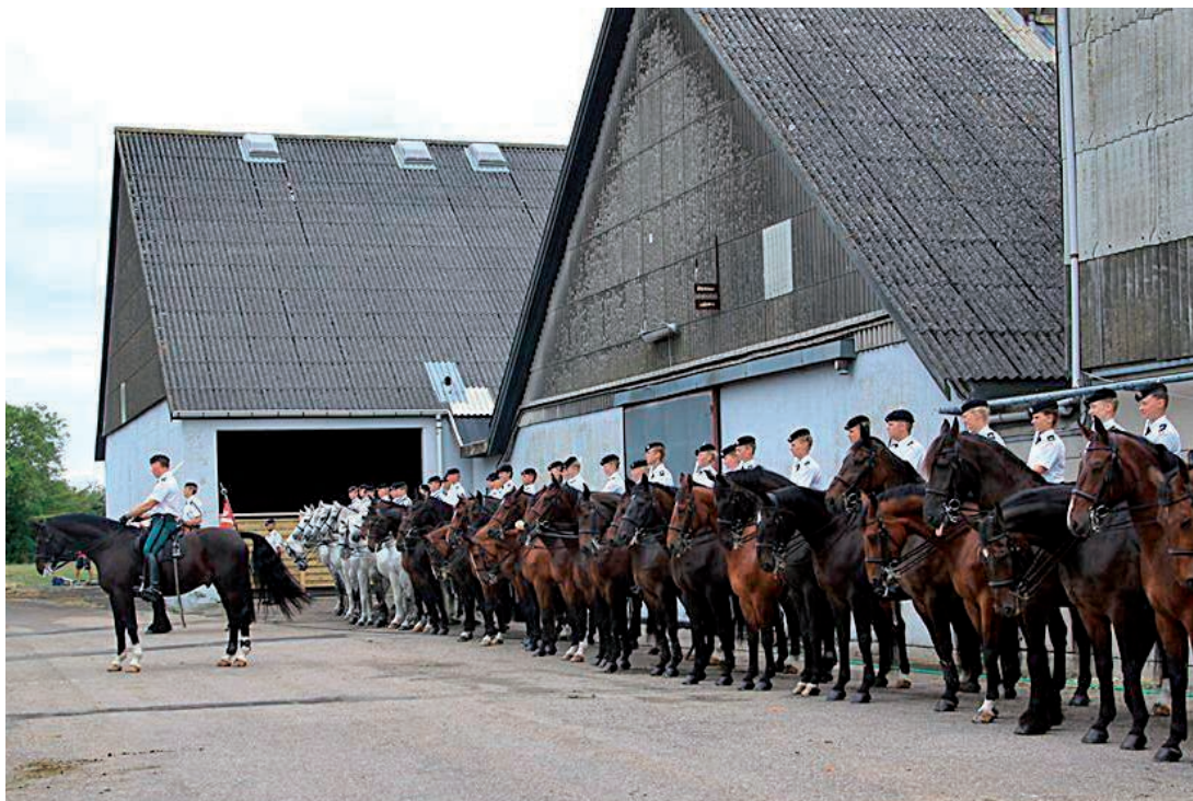
Garderhusarerne foran vognmuseet