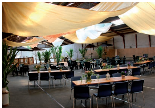
Den flot pyntede ridehal

Den ene ridehal var i dagens anledning lavet om til festsal, og det var gjort rigtig flot. Det gav en festlig stemning, og der var virkelig pyntet op.