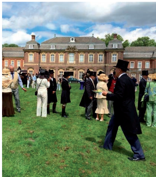
Klar til turen