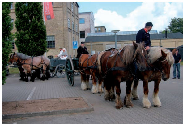
Besøg på Slesvigske Vognsamling

Dagens rute gik til Haderslev via Genner. Ikke langt fra Åbenrå besluttede vejrguderne sig for at linde lidt på vandhanerne. Det skal siges, at en 1864-uniform og damernes kjoler ikke længe holdt kaskaderne af vand ude. Følgebilerne var allerede i Haderslev, så valget var sådan set enkelt - at fortsætte iført slaskende våde klæder og ikke