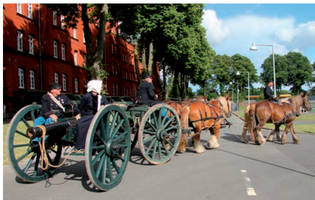
Ved Haderslev Kaserne

I Haderslev blev vi modtaget ved Slesvigske Vognsamling af en skare på omkring 40 mennesker anført af museumslederen på museet og Haderslevs Borgmester. Til trods for at dagens rute var på omkring 30 km, lykkedes det os at nå frem med kun 10 minutters forsinkelse. Det var virkelig fantastisk at blive mødt på denne måde ved museet. Et møde som vi virkelig havde set frem til. Kanon-lavetten, forstillingen og fouragevognen var alle blevet genopbygget på Slesvigske Vognsamlings værksted, så vi følte, at det var vigtigt at aflægge netop disse gæve og dygtige mennesker et besøg. Vognsamlingen havde forberedt frisk frugt og øl og sodavand. Det var lige, hvad vi trængte til. Skulle der være nogle, der endnu ikke har aflagt denne fantastiske vognsamling et besøg, så kan det varmt anbefales.