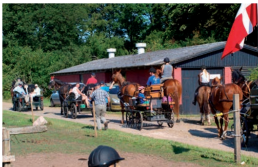
Så er ekvipagerne klar

Vendsyssel Køreforening på Holtegaard dannede i uge 30 rammerne omkring sommerferieugen med hest og vogn. Elleve spand heste var på tur den dag, der var flest med. Tre ryttere var også med. Der var sat ekstra fokus på børnene, så der var arrangeret diverse aktiviteter om aftenen for dem.