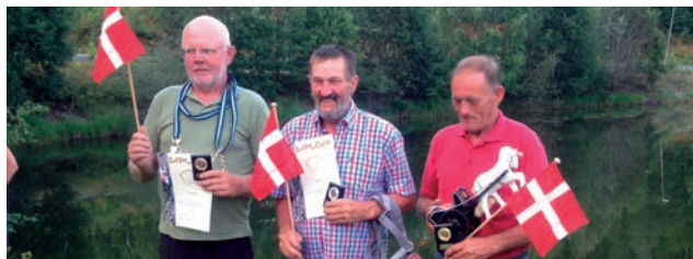
Vinderne i pony-klassen