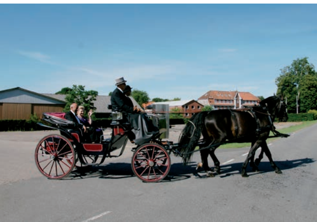
Guldbrudeparret på vej