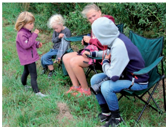
En pose slik er ikke at foragte