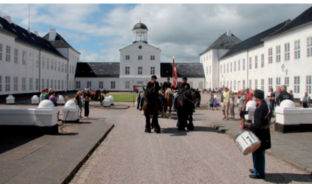
Gråsten slot blev også besøgt