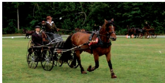
Landsstævne på Kærsgaard