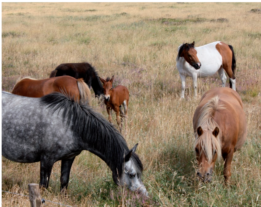
Det har været en dejlig sommer med mange gode sommerdage

Nu lakker det jo mod efterår og vinter, og aktiviteterne i selskaberne bliver ikke de samme, som når solen står højt på himlen, men der vil dog stadig være mange arrangementer, som det vil være hyggeligt at komme til.