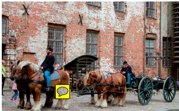
Koldinghus gav den rigtige stemning