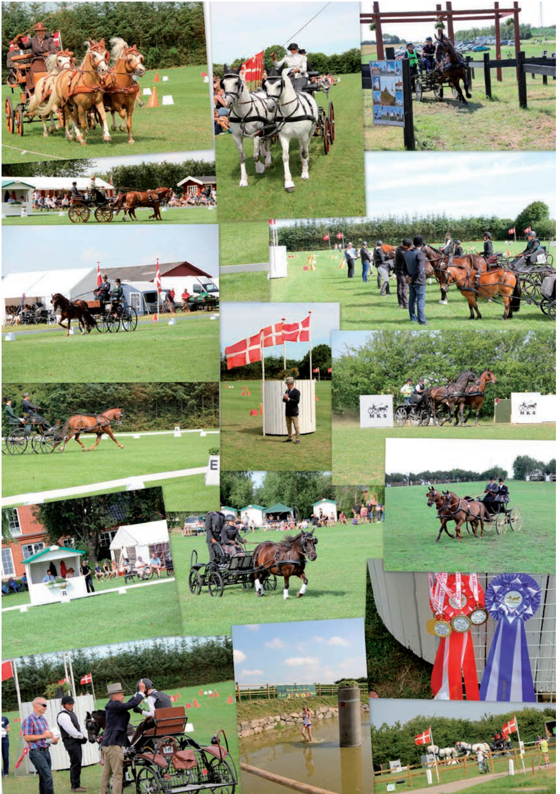
Stemningsbilleder fra DM