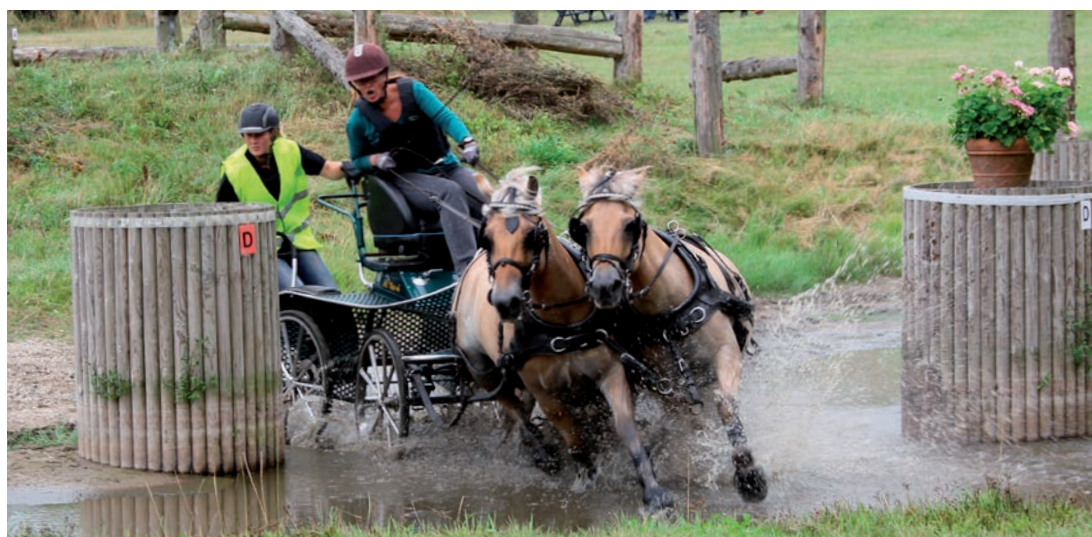
Stævne i VK