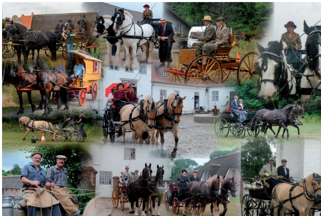
Ekvipagerne på Nr. Vosborg

Julebanko kl. 19.00 på lærerværelset, Højgårdsskolen, Ingridsvvej 2 Lind, 7400 Herning. Traditionen tro kalder foreningen til årets højdepunkt. Der spilles ti bankospil med flotte gevinster, og der er efterfølgende amerikansk lotteri og traktement til ganen. Invitation følger senere.