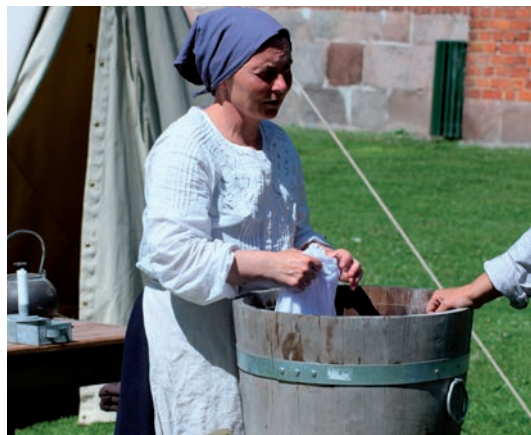
Så var det tid til skjortevask

Koldinghus og syslede med forskellige gøremål, såsom at vaske soldaternes skjorter i den medbragte træbalje.