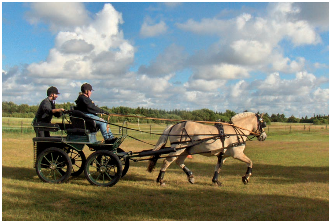
Christa med Laban til køretræning