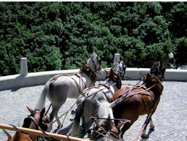
Der er ikke så meget plads

Jeg er ikke i tvivl om, at det kræver en fantastisk dygtig kusk at udføre dette arbejde, så det var spændende at møde en person, der på den måde er dedikeret til kusejobbet.