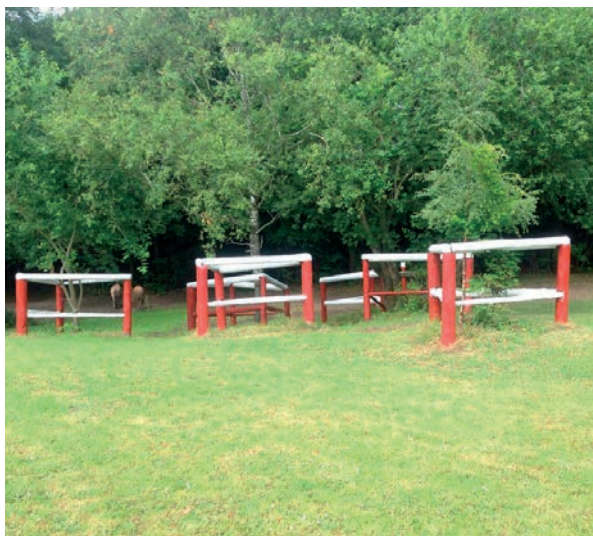
"Pædagogen" er blevet malet

En god håndfuld var mødt op til vores arbejdsdag, hvor vi startede med en kop kaffe. Det var desværre ikke vejr til at male denne dag, men vi havde også andre gøremål. Vi ryddede op i containerkassen, beskar træerne i skovforhindringen og ved pædagog-forhindringen samt andre småting. Efter et par dages tørvejr blev vandgraven og pædagogen malet. Vi vil gerne takke de fremmødte for hjælpen.