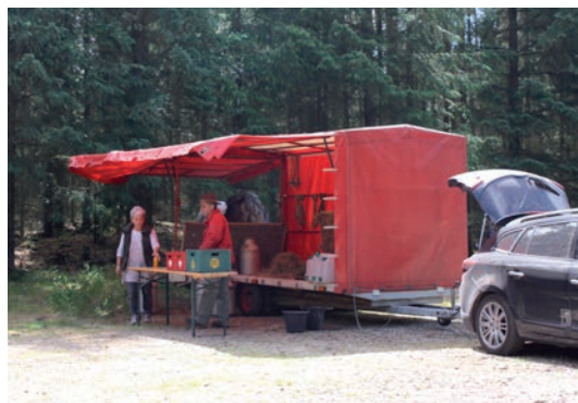
Servicevognen var klar undervejs