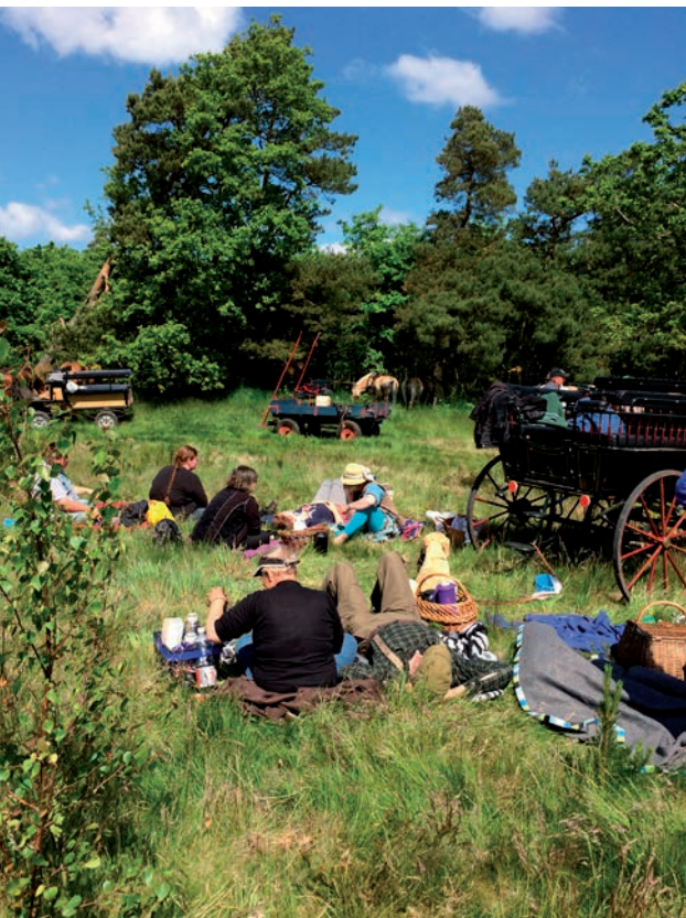
Frokost på Oudrup Hede