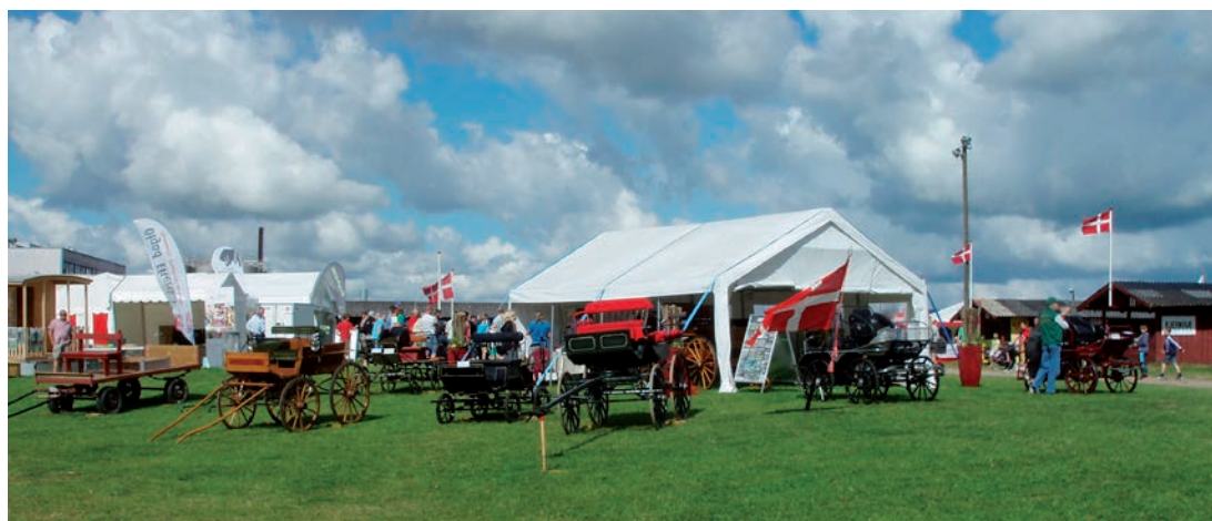
En flot stand på dyrskuepladsen i Horsens

Standen var rigtig godt besøgt. Der var stor og seriøs interesse for vores forening, og det gav indtil flere nye medlemmer, så man må betragte vores tilstedeværelse som en stor succes.