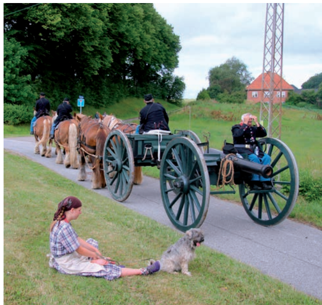
Et lille hvil på en varm dag