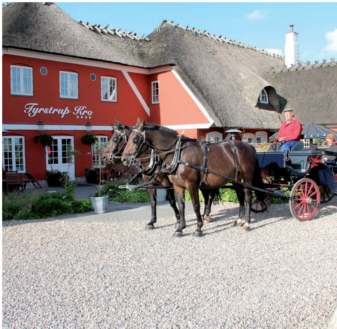
Så bliver det ikke mere idyllisk