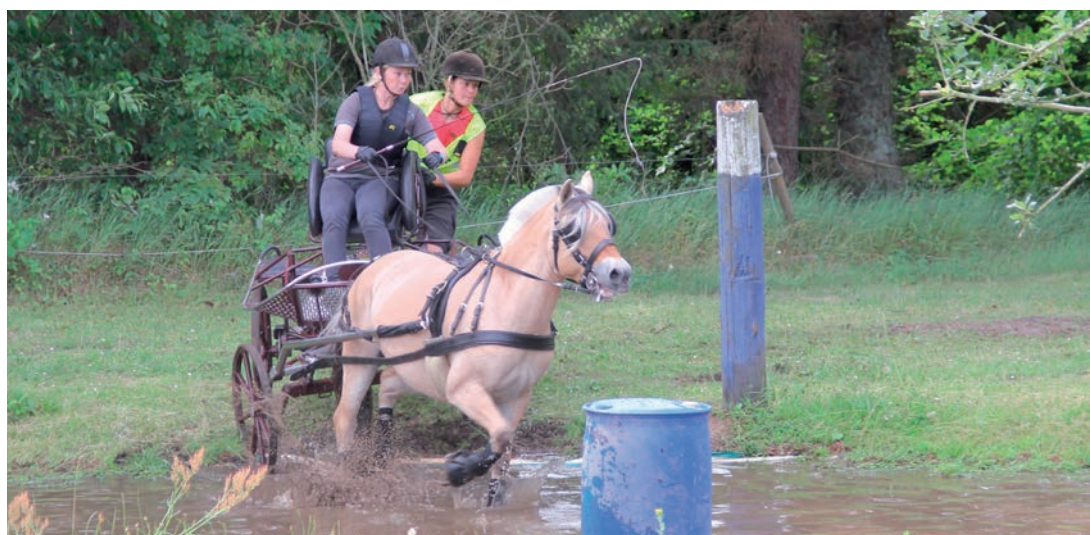
Stævne ved MKS