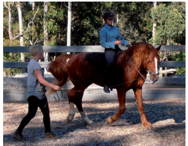
Garys kone træner heste, her en hingst i Australien