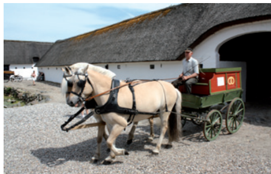
Fjordheste for original bagervogn

Nedenfor vil I se en annonce, hvor jeg søger en medhjælper til at skaffe sponsorer til bladet. Vi skal gerne have flere til at annoncere i Køresporten , så vi fortsat kan have en god økonomi for bladet. Det blev besluttet på vores første møde i PR-udvalget, at en adresseliste vil blive udgivet elektronisk i stedet for som blad, da en sådan liste hurtigt vil kunne ajourføres.