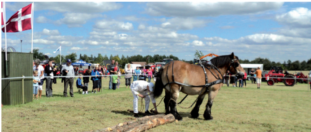
Det kræver en rolig hest at flytte rundt på træstammer.