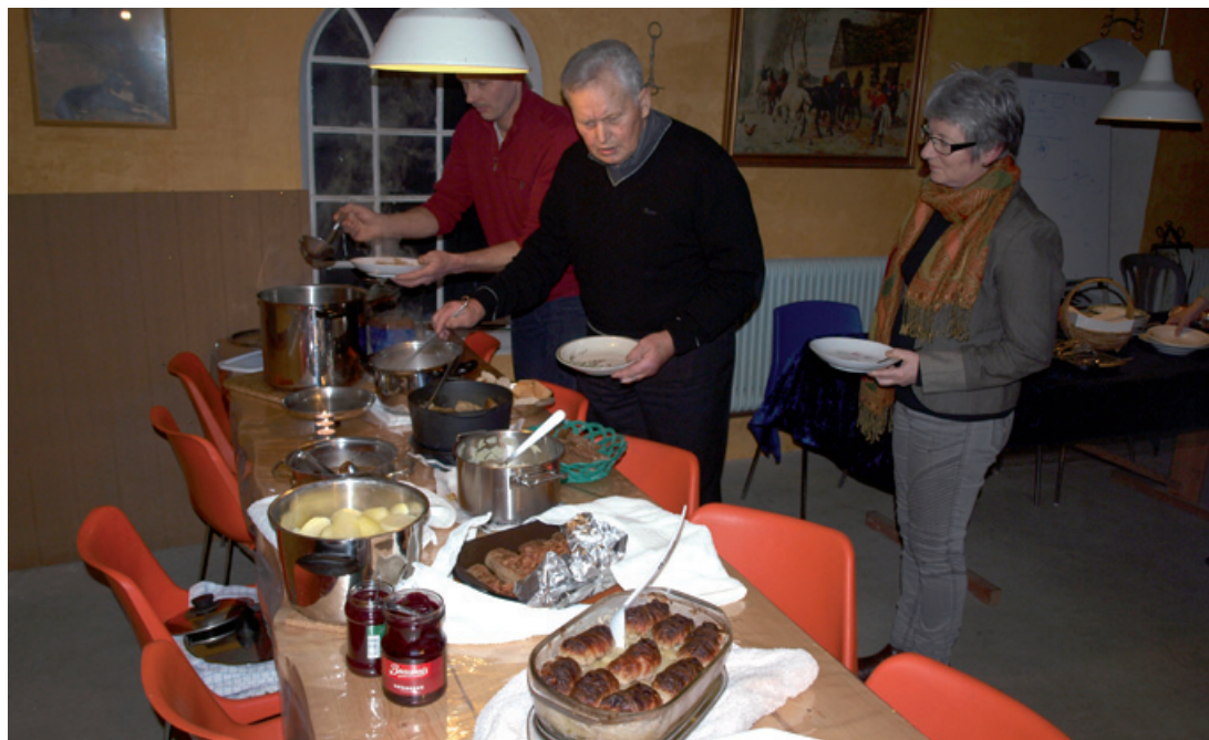
Der langes godt til fadene