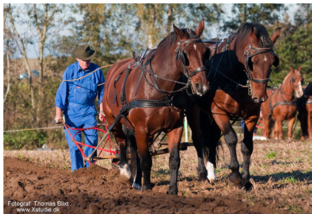
En dejlig dag i marken.