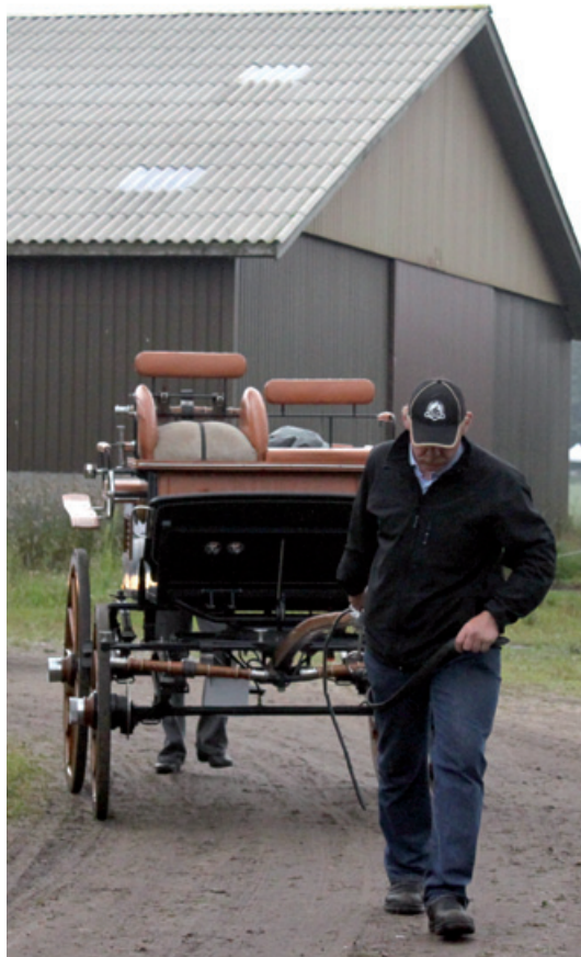
Det er hårdt at være farmand.

Spis-sammen-aftenen var, som de andre år, en stor succes, hvor der heller ikke i år, var skyggen af et salatblad. Næh, det var mad efter gode gamle opskrifter, og de omkring 35 fremmødte nød det i fulde drag. Og dessert manglede bestemt heller ikke. Så mon ikke den aften er kommet for at blive?