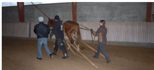
Første gang med lægter på siden.