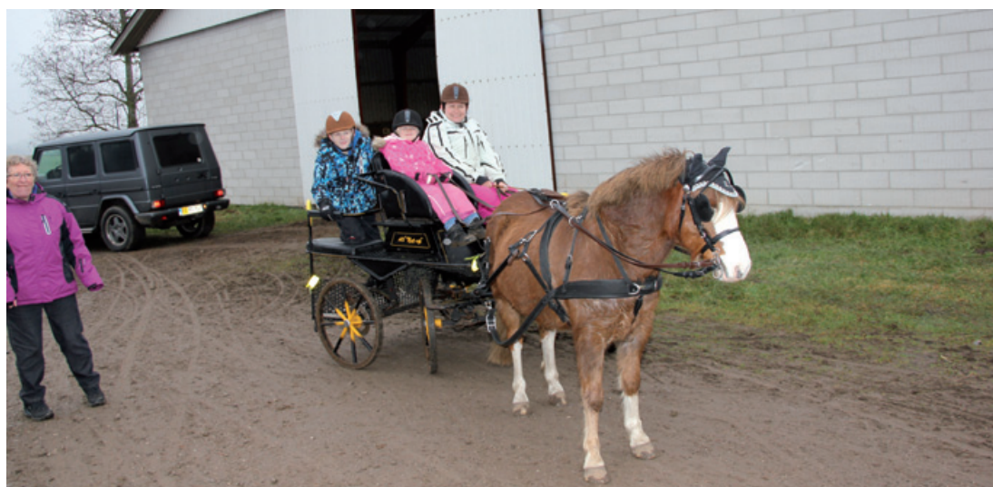
Naja klar til en tur gennem forhindringerne

Jeg kan kun opfordre til at komme til dette stævne, enten som kusk eller bare som tilskuer. Det er altid hyggeligt, og der er tid til sjov og spas.