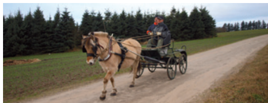
En glad kusk og hestejer på vejen for 3. gang.