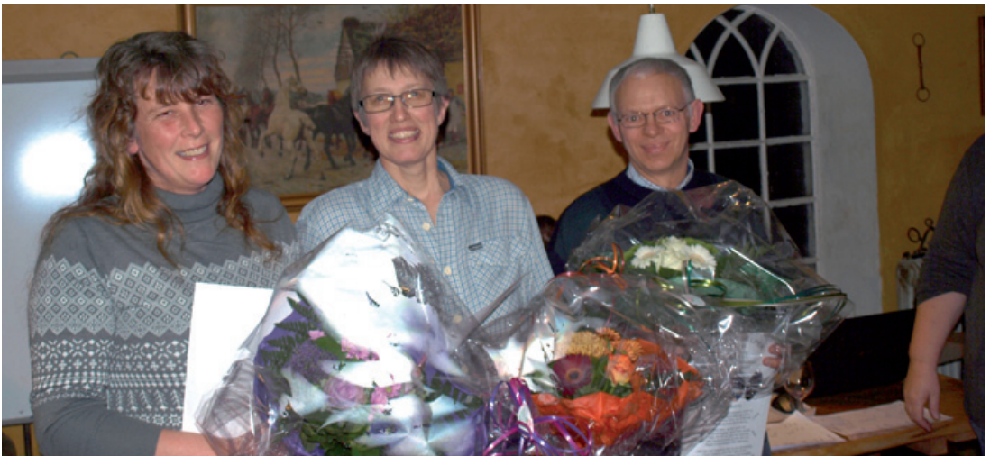
Tre glade Årets Hjælpere.

Julefrokosten blev som sædvanlig en hyggelig aften, hvor julemaden blev rystet godt og grundigt på plads i forbindelse med det efterfølgende pakkespil. Jagten gik lystigt mellem alle 3 borde, og det var ikke alle, der fik de pakker med hjem, de var gået efter. Men her gjaldt ordene "tab og vind med samme sind". Alle gik fra julefrokosten med følelsen af at have vundet noget – nemlig deltagelse i en sjov og hyggelig aften. Og det var ik' så ring' endda.