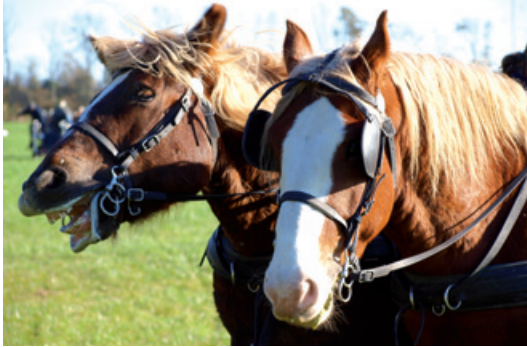
Det er da dejligt at være hest.