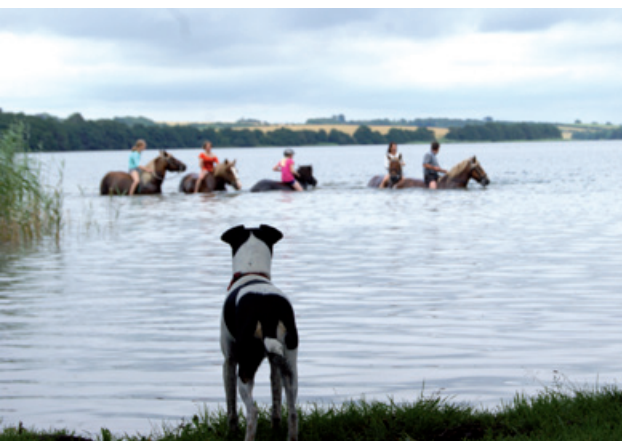
En badetur er ikke at foragte.

Dertil skal jeg så lige sige, at vi siden 1994 har lavet hestevognsture i Danmark og Tyskland. Vi har i alle årene aldrig haft brug for traktor hjælp. I 2011 har vi haft brug for motoriseret hjælp hele 2 gange. For at hive en vogn ud af mudder og for at komme op ad en stejl bakke i Hobro.