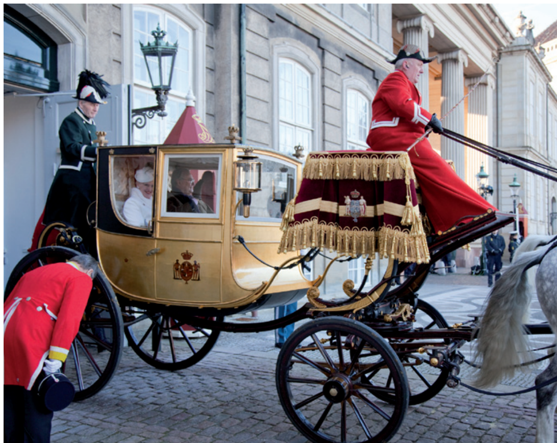
Regentparret kører ud fra residenspalæet på Amalienborg.

Et 40-års regentjubilæum er en yderst sjælden begivenhed i danmarkshistorien. I hele kongedømmets over 1000-årige historie er der for Dronning Margrethe II kun to monarker, om hvem man med sikkerhed kan sige, at de har opnået at beklæde tronen i 40 år: Christian 4. i 1628 (eller 1636 hvis man regner fra kroningen) og Christian 9. i 1903 (konge af Danmark 1863-1906).