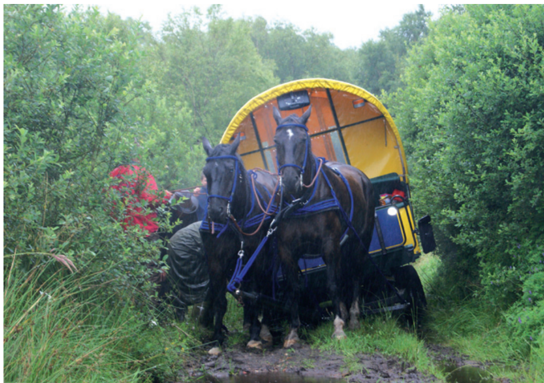
Sådan kan det gå, når det bliver for blødt

Hilsen Bente Lüch fra Emmelsbüll-Horsbüll (10 kilometer syd for Tønder).