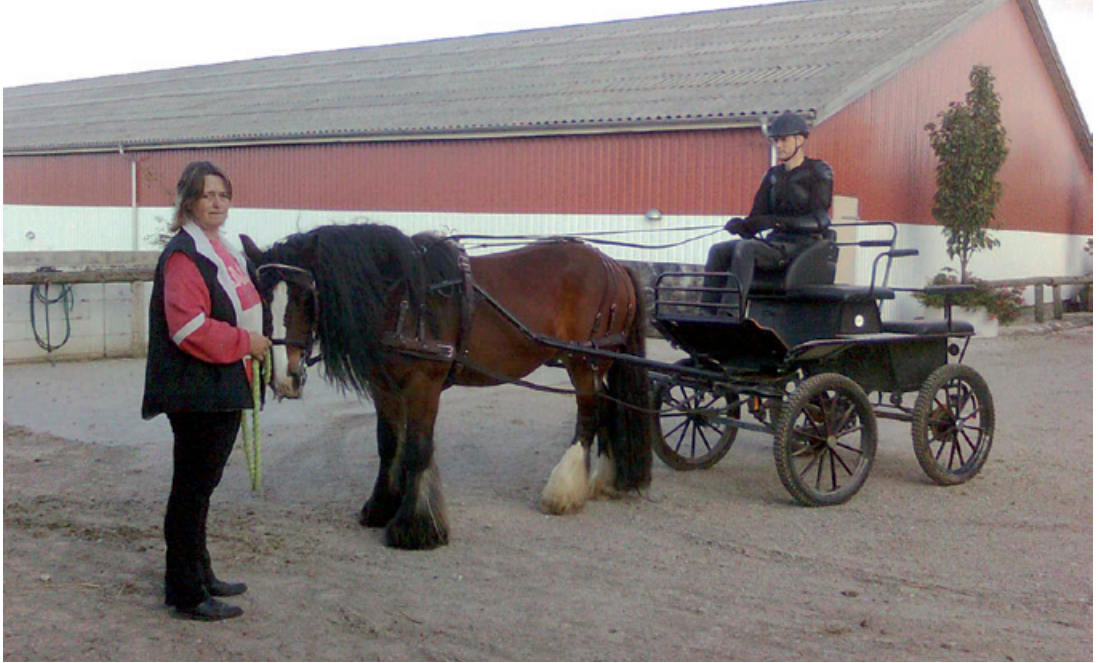
Min første tur i egen vogn.