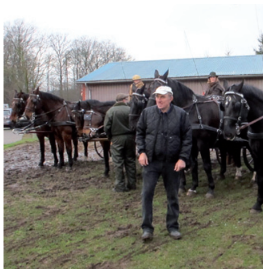
En glad fødselar.