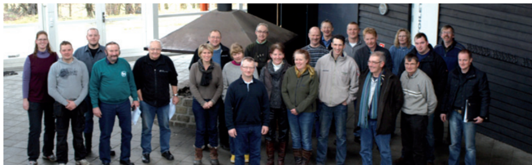
Kursister til banebyggerkursus.