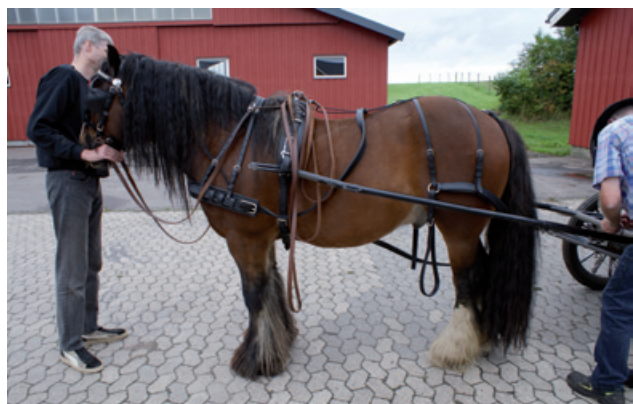
Duke's første forspænding i 3 år.

Så skulle vi kigge efter ny hest. Den skulle både kunne rides og være tilkørt – og ikke mindst være trafiksikker, da vi ikke kun ville opholde os i ridehuset. Det skulle vise sig at være noget af en udfordring at finde en ride/kørehest, som ikke skulle være en Oldenburg. Vi satte næsen op efter en norsk dôle eller en nordsvensk. Vi kiggede på diverse sider på nettet, men når der dukkede noget op, var det enten 2-spand, ikke trafiksikkert eller allerede solgt. Efter at have kigget på en otte-ti stykker, fandt vi endelig noget, der kunne bruges, troede vi. Vi bor i Roskilde og har været både på Vestsjælland, Nordsjælland og i Jylland uden held.