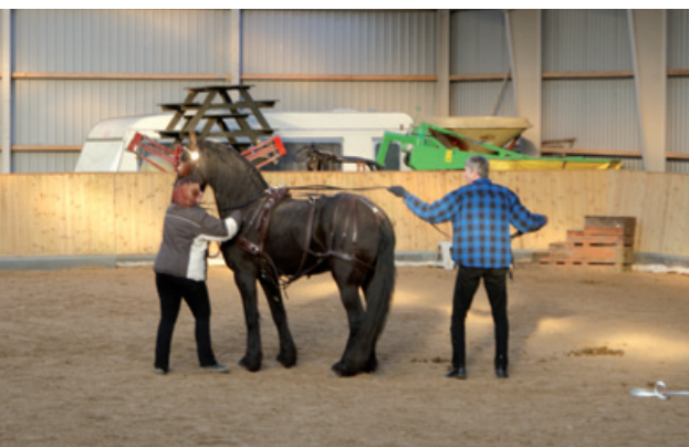
Linetræning med frieseren.