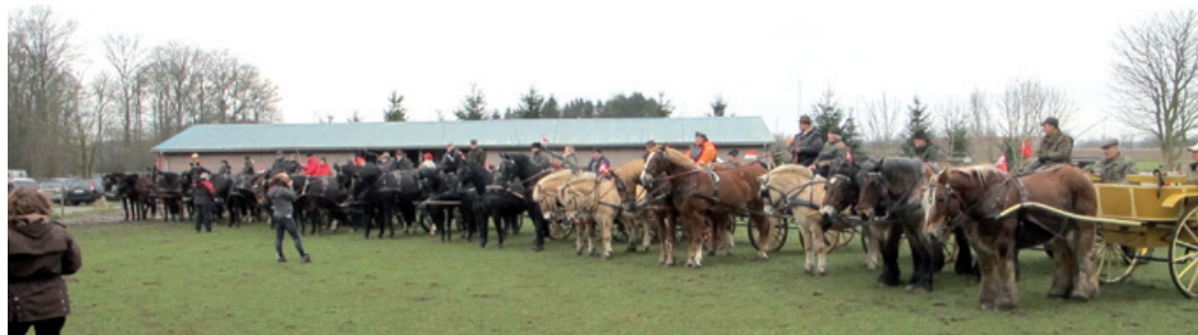
Flot så det ud med 16 ekvipager.