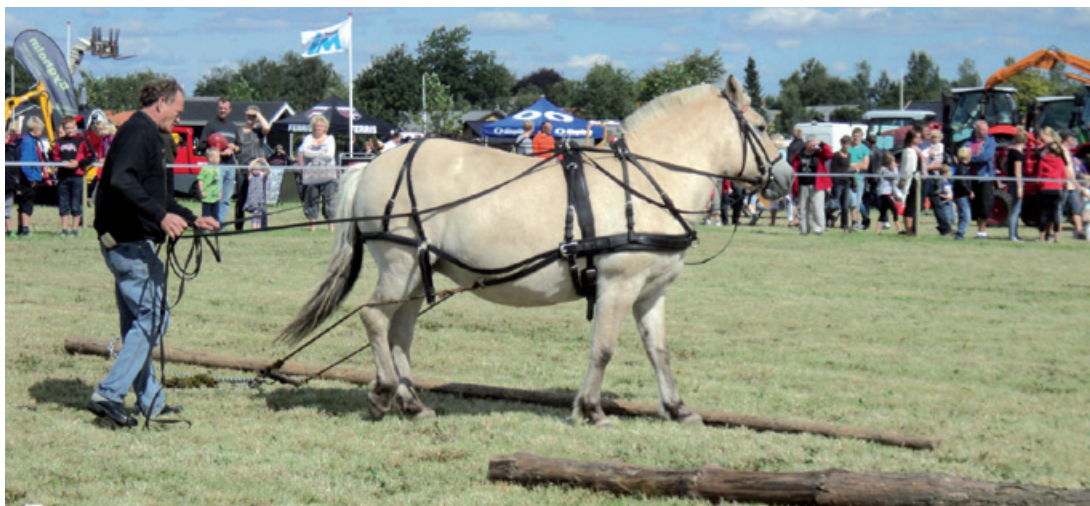
Der er også en del publikum, der ser, hvordan det foregik engang.

Tilmelding senest onsdag den 21. april på 2183 8123 Eller mail: e.larsen@dlgpost.dk