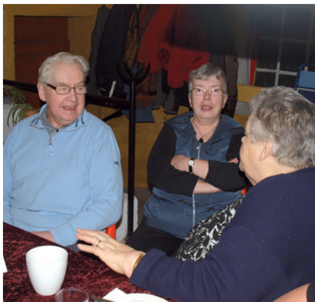
Snakken gik lystigt til Spis-sammen-aften