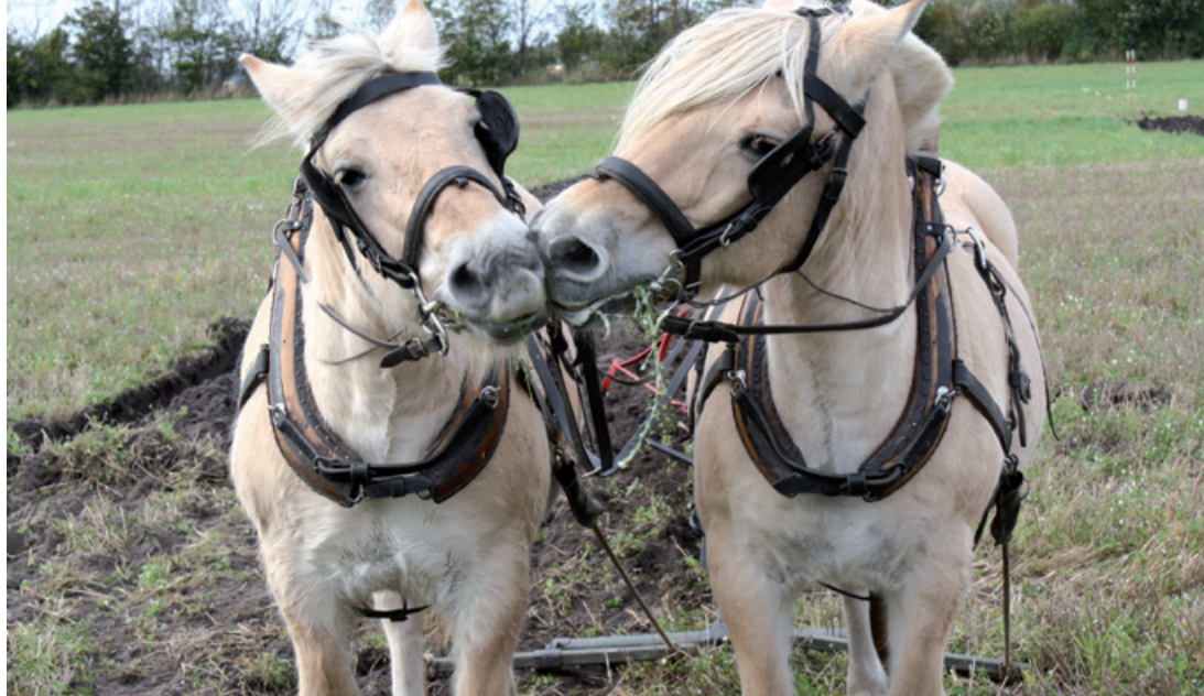
Der skal da også være tid til hygge.