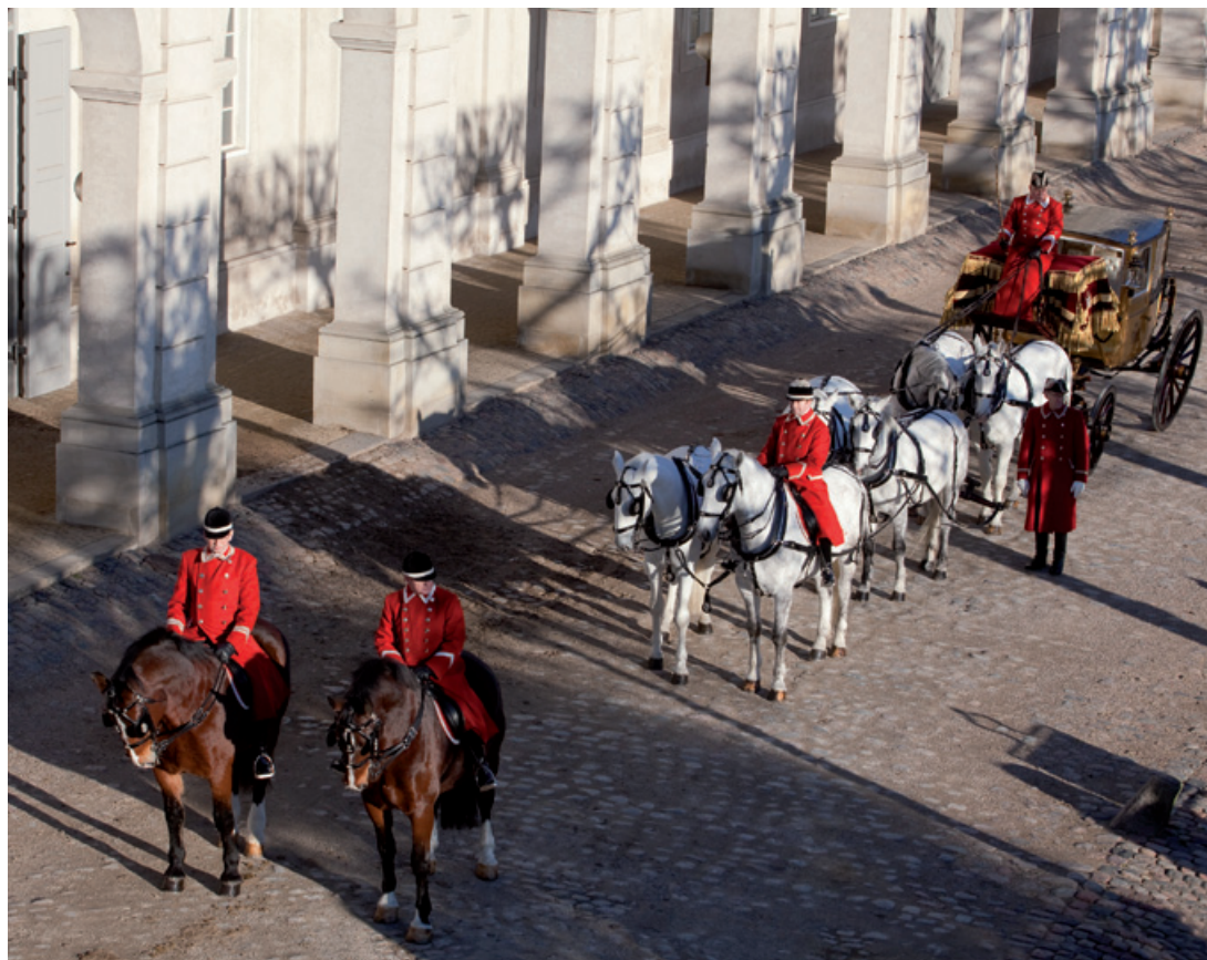
Ekvipagen holder klar på Christiansborg.