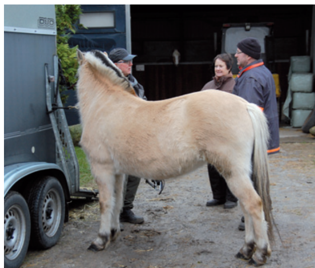
Det er jo rart med gode råd, og dem er der heldigvis nok af.

Jeg har på nuværende tidspunkt været ude at køre på landevejen med tohjulet træningsvogn og med maratonvogn. Hesten vi havde uheldet med, er jeg også begyndt at øve med. Målet med skovtur med familien bagpå kommer tættere og tættere på.