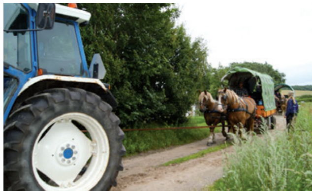
Det er da godt, at landmændene er gået over til traktorer.

Næste dag i silende regn var mottoet: survival of the fittest: Vi kørte en strækning i skov og krat, hvor en tung vogn pludselig sank så langt ned i dybet, at hestene ikke mere var i stand til at trække den ud igen. Så der måtte flere hestekræfter til... En rytter fik organiseret en traktor i landsbyen, og den trak vognen ud. De andre vogne vendte om og kørte en "lille" omvej til næste overnatningssted. Denne "lille" omvej var dog ikke uproblematisk. Undervejs punkterede et dæk på en anden vogn, så tiden var næsten ved at løbe fra os. En vogn i mudder og en punkte-