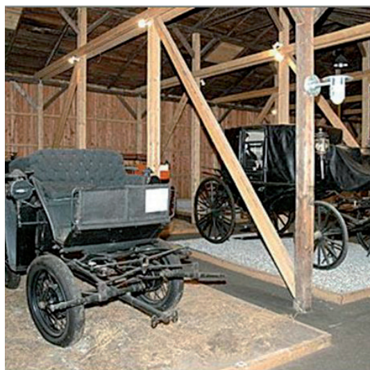
Vognmuseet i Horsens.

Fra Statsfængslet i Horsens, som i over 150 år modtog fanger fra hele landet, er der en spændende og interessant udstilling. Alle udstillede genstande er autentiske, og mange er der sågar navn på. Forhenværende justitsminister Peter Adler Alberti er "æret" med en særudstilling om de år, han var indsat i Statsfængslet på grund af en svindelsag på niveau med Stein Bagers.