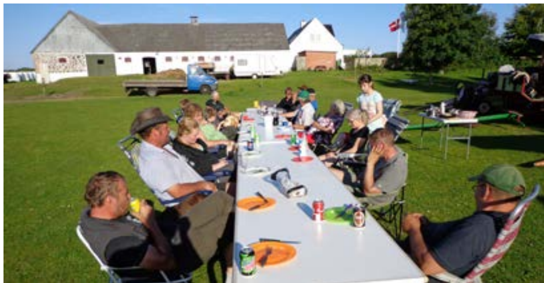
Næsten alle deltagere på "Himmerland på tværs"

Himmerlands Køre- og Rideforening havde indbudt alle køreforeninger til deltagelse i en ferietur på tværs af Himmerland. Nu håber vi, at Thy