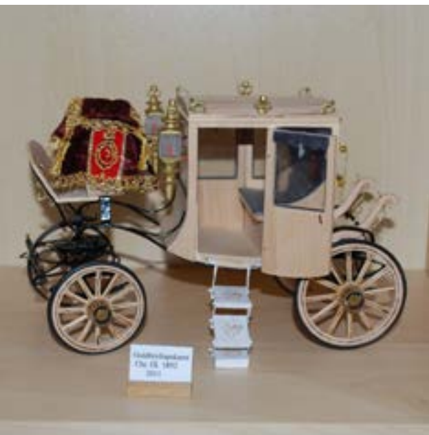
Guldbryllups karet 1892

"I kører med heste, så du må kende en hel masse til hestevogne". Bordherren afslørede derpå sin vinterhobby gennem flere år, nemlig at bygge mikrokopier af hestevogne i træ. Vi kendte da hinanden fra gymnastikken i midt-60'erne, hvor vi flyttede til Faxe! Men det her var nyt for mig, og et besøg blev aftalt.