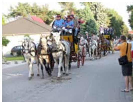
En del af de 72 ekvipager på vej gennem Brück