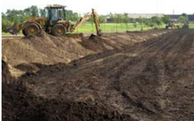
Der skulle lidt flere hestekræfter til