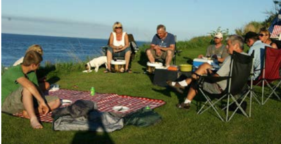
Den sidste aften på Stenkoppel