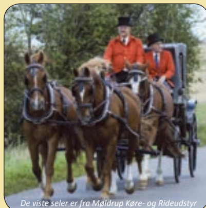
De viste seler er fra Møldrup Køre- og Rideudstyr

Gl. Horsensvej 337, Gjesing, 8660 Skanderborg • Tlf: 86 53 10 11 • www.moldrup-rideudstyr.dk