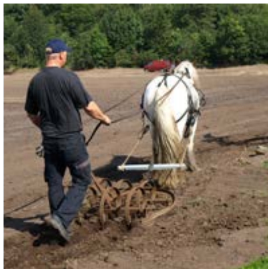
Så skulle hestekræfterne i gang

med skovl, rive, motorsav, traktorer med frontlæssere og vogne. Ikke mindst blev Per's tinkerhest forspændt for harven - op og ned af banen det gik – hvis en køreforening ikke skulle bruge rigtige hestekræfter til sådan et arbejde – hvem skulle så?