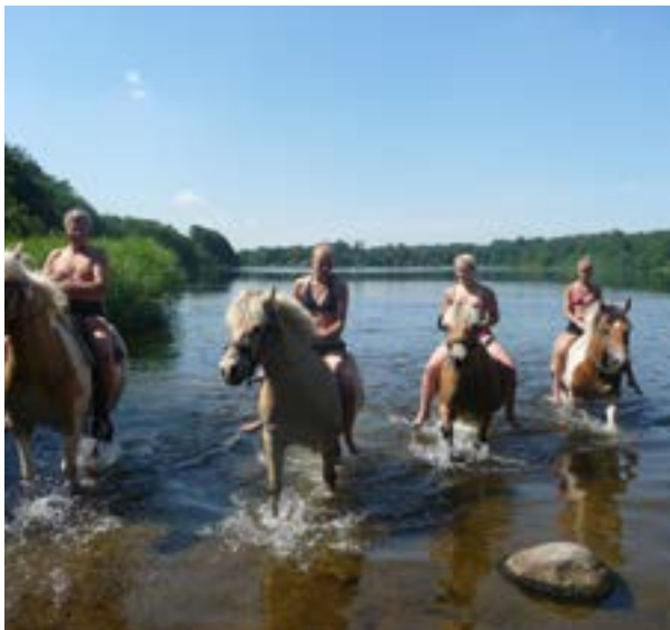
Så er vi klar til det, vi kom for

Efter en times tid er vi klar til hjemturen, men inden vi kører, er vi rundt og fjerne hestepærrer fra søbredden og parkeringspladsen, så der er pænt rent til de næste, der kommer. Vi skal huske på, at ikke alle kan lide heste, og vi fylder jo meget.