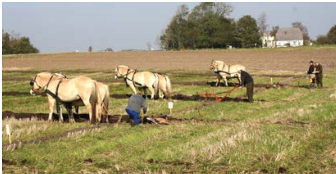
Så er det tid til pløjning igen