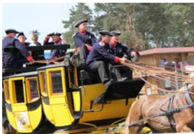
Mange har fat i linerne

Når vi efterfølgende ser på billederne, som Jan har taget, kan det ses, at det ikke kun er kuskene, der har fat i linerne. Der er ikke mindre end 5 personer, der sidder hver med en håndfuld, hvilket jo er ganske naturligt, da én person jo ikke kan holde alle liner. Alligevel synes jeg, det er en præstation udover det sædvanlige, da der jo trods alt skal holdes styr på det hele.