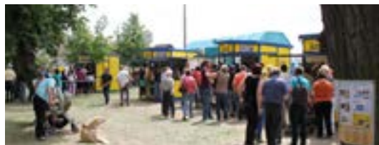
De 5 billetboder foran indgangen