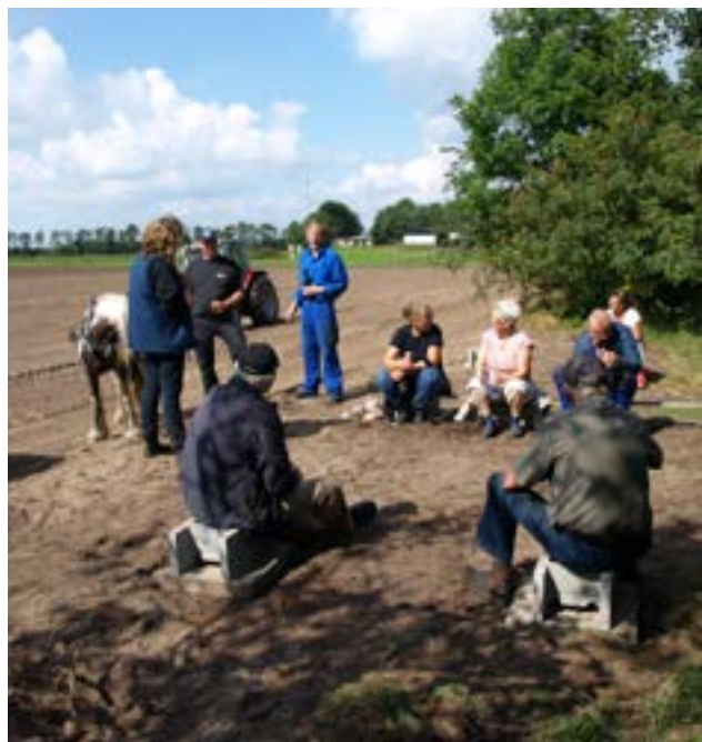
Alle kræfter samlet til lidt opladning

Ved dagens slutning var kanter revet og rettet til. Nu mangler der stadig et stykke arbejde, men vi når at så græs rettidigt, så det kan komme til at danne rammen for tre gode baner til Nordisk Mesterskab og ikke mindst andre aktiviteter på kørecentret fremover.