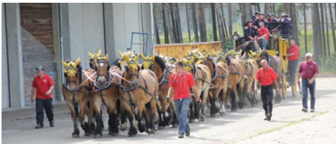
En stille og rolig tur gennem staldområdet

Da jeg havde fået et pressekort, var det muligt for mig, at komme ud i staldområdet, og det gjorde naturligvis, at jeg var nødt til at komme ud bag ved, for at høre hvad der får en kusk til at spænde så mange heste for.