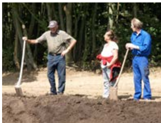
Det hårdt arbejdende team

Fra næste stævnesæson kan vi til gengæld tilbyde optimale forhold for såvel deltagere som hjælpere. Planen er, at al aktivitet fremover skal foregå i samme område, dvs. på arealet mellem Holtegaardsvej og V. Hassingvej (forhindringsområdet). Der bliver plads til tre dressurbaner ved siden af hinanden, afskærmet område til tilskuerne og adgang til minimum 5 forhindringer i gåafstand. Til gengæld bliver opstaldning, parkeering og camping nede ved staldområdet, så der er mere ro.