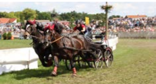
Vinderen af koldblodsræset i 2-spand

Så blev det tid for væddeløb, som foregik dels med heste for vogn men også på hesteryg. Der var en rund bane på 500 m, hvor start/slut var i hver side, så der kørte 2 spand af gangen. Igen må jeg sige, at når de store heste kommer op i fuld galop, så rykker det. Man kunne ligefrem mærke i jorden, når de kom forbi. Jeg havde det da også sådan, at jeg lige rykkede lidt væk fra barrieren, når de kom forbi. Der var godt nok knald på, men der er ingen tvivl om, at hestene havde prøvet det før. De vidste lige præcis, hvad de skulle og stod nærmest som en løber i startblokkene, mens de ventede på startsignalet.