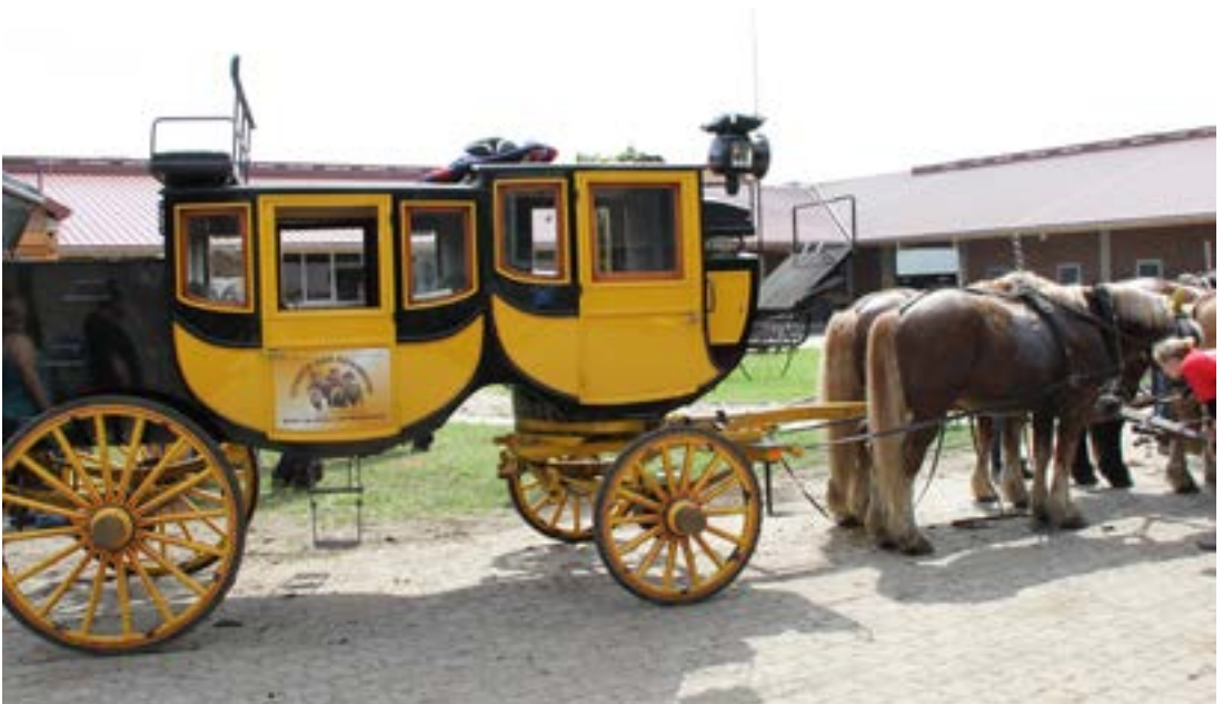
Den smukke postvogn

nisch-Deutsches Kaltblut, men også andre koldblods racer. På deres hjemmeside kan man se, at de har 8 avlshingste og mange flere hopper, så der er lidt at vælge imellem. Udover shows kører Haseloff stuttoriet også brudekørsel, kaperkørsel, turkørsel, og meget mere.