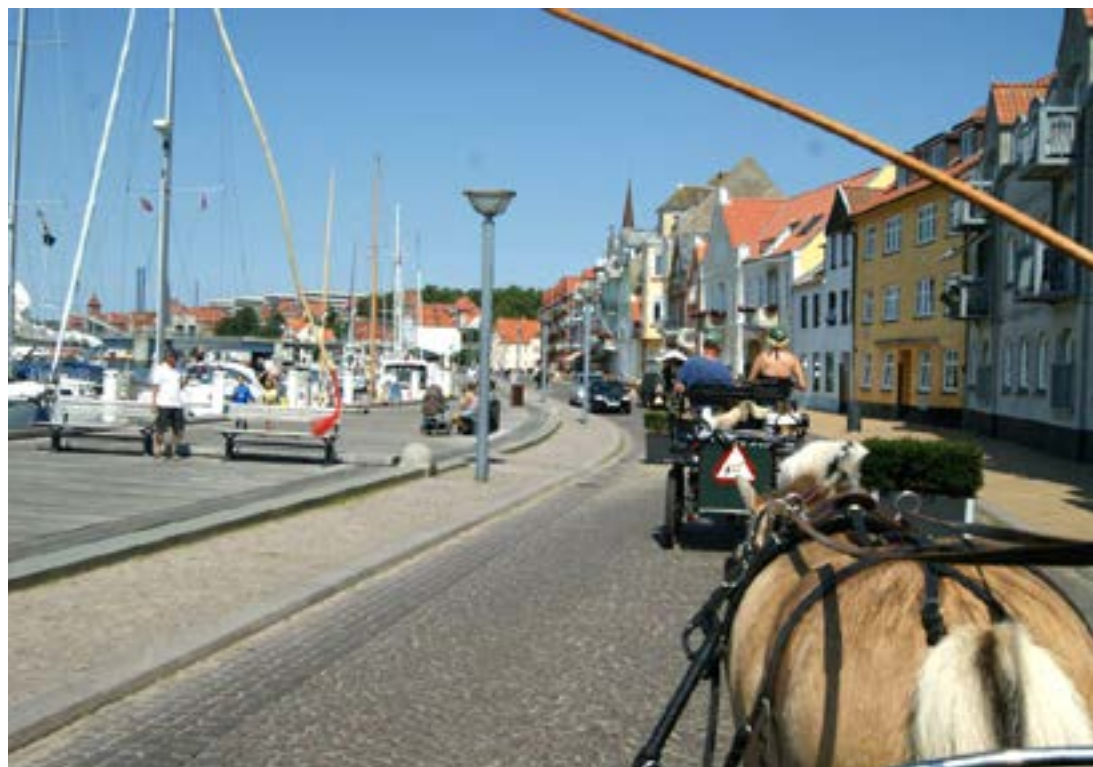
Indkørsel til Sønderborg/havnefronten

Vi har fået mange positive tilkendegivelser undervejs og har i virkeligheden bare kunnet slappe af, nyde naturen og bedrive det, som vi alle sammen brænder mest for, nemlig at køre hestevogn, i alt 136 km på 6 dage.