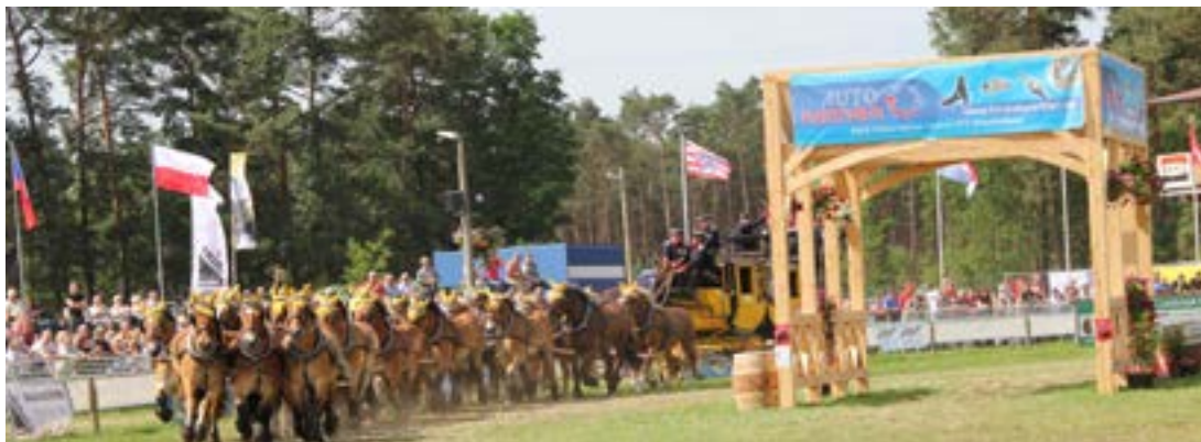
Det imponerende skue for publikum