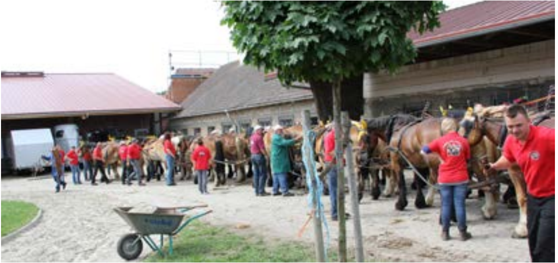
Så er det med at få spændt fra