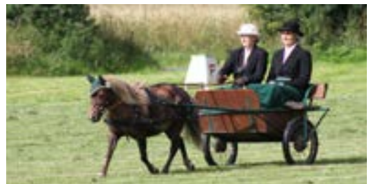
Top Cup er en god konkurrence for de små shetlændere

Det var rigtig dejligt, at så mange havde fundet nordpå for at deltage i Top Cup.