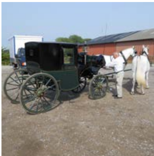
Coupé Barker, Chandos St. London

Engelsk coupé fra Barker & Son, Chandos Street, London.