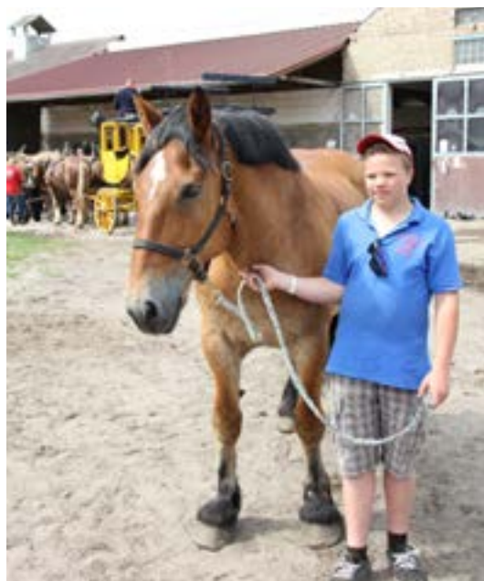
Den 19 år gamle Jumper

med de 23. Til det var svaret: Vi har da prøvet det en enkelt gang. Igen må jeg så bare sige, at det må være dygtige kuske og veltrænede heste.