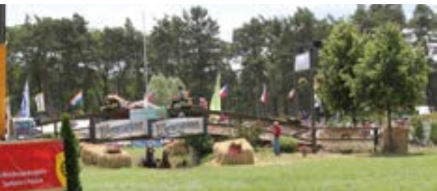
Her ses et spand over broen og et under

opbygget således, at der kørte 2 spand på én gang (forhindringerne var bygget spejlvendt, så det kunne lade sig gøre). Derfor kunne publikum med det samme se, hvem der var hurtigst, hvilket gav en fantastisk stemning, især når der blev kørt rigtig stærkt. Jeg skal hilse og sige, at når sådan 4 store koldblodsheste først kommer op i fart, så er det ikke ligefrem Hjerl Hede, man tænker på. Jeg har fået oplyst ved Titanen, at der køres med ca. 40 km i timen.