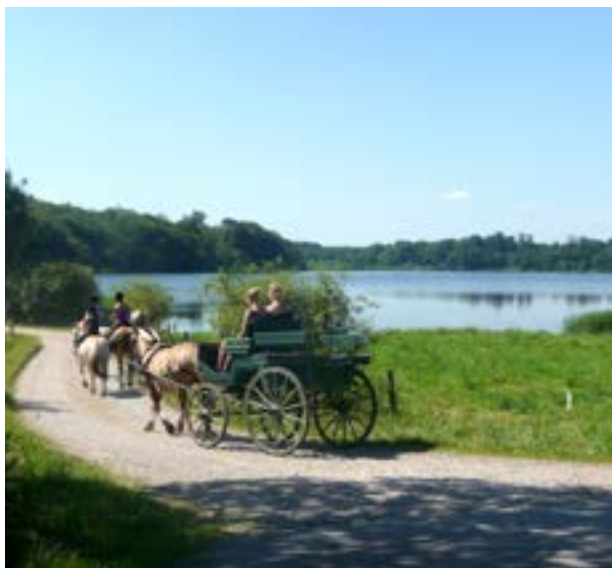
På vej til søen

Når kaffekurven er pakket, og alt er klar, kører og rider vi de 7 km ned til Jels Sø. Endelig ankommer vi til søen, og nu er det jo spændende, om der er plads til os.