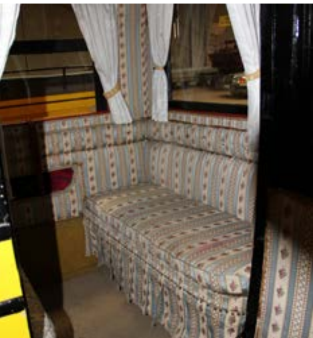
Det romantiske look indenfor