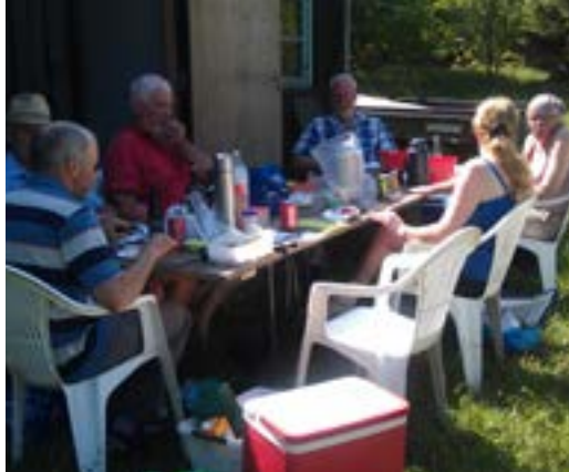
Frokost i det grønne