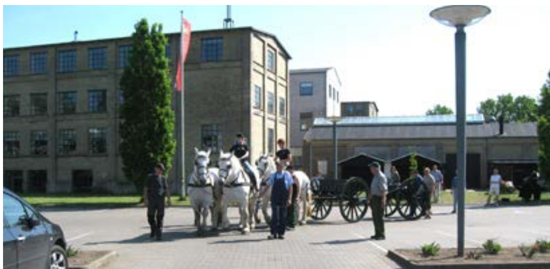
Generalprøve i a'la daumont med kanon uden rør