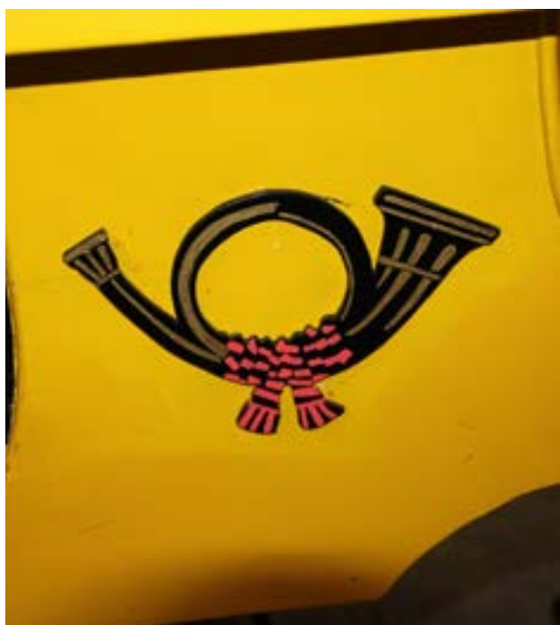
Det karakteristiske posthorn

Vognen kørte oprindeligt fast mellem Bad Mergentheim og Dörtzbach fra 1875 til 1914, hvorefter den efter 1. verdenskrig kom til Frankfurt am Main. Det forklarer uniformen, som er