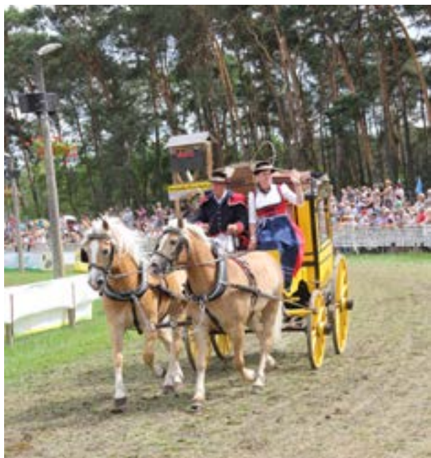
Postvognen ved præsentationen