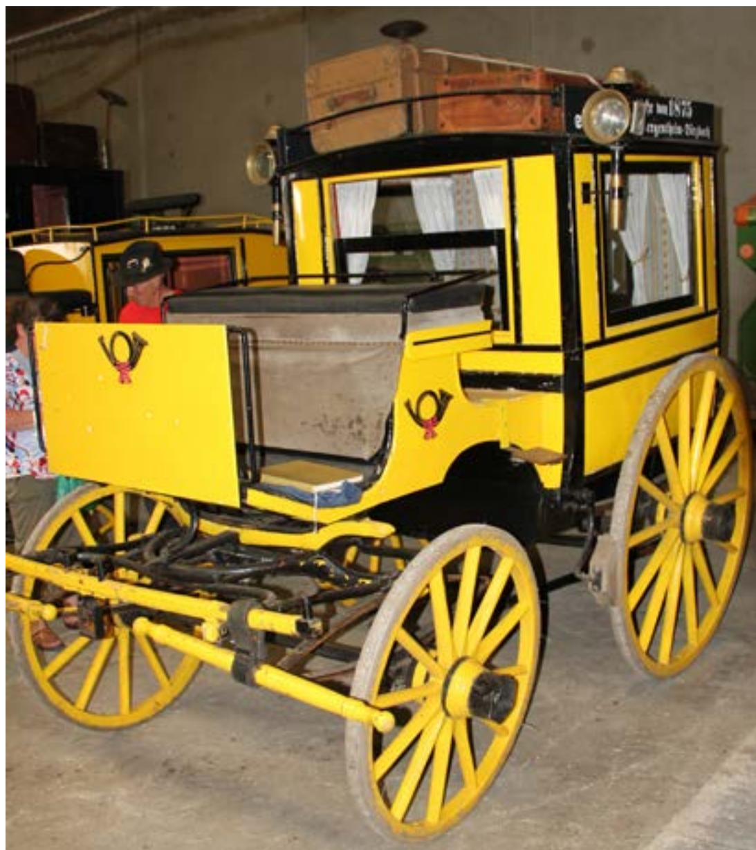
Postvogn fra 1875

muligt at leje den for et par dage, hvis man har lyst til at prøve, hvordan det var at rejse før i tiden. Det romantiske look indenfor er nok ikke helt, som det så ud i 1875, men hyggeligt ser det da ud. Der er givetvis mange brudepar, der kunne ønske sig denne transport til og fra kirken. Der var en særlig gæstebog, man kunne få lov at skrive sig i, hvis man havde været på tur med denne gamle postvogn.