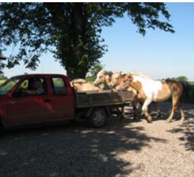
Hvad skal man med trækkeov, hvis man har en ladvogn med korn

Når vejret er til det, og temperaturen er over 20 grader, spænder vi for hestevognen og samler børn, børnebørn og naboer sammen.