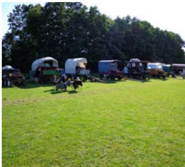
Vognene linet op

Undervejs kom der nogle trykninger på nogle heste fra seletøjet. Det blev klaret ved blød beskyttelse og justering af remme. Det varme vejr, de mange bakker og ture på 30 km har nok medvirket til generne. Utroligt som hestene blot trækker sejt, selvom noget gør ondt.