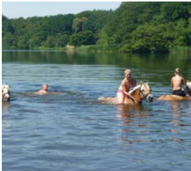
Med eller uden hest er det jo bare dejligt at bade

Når badningen er slut, binder vi hestene til et træ, og så er der kaffe og saftvand til alle.