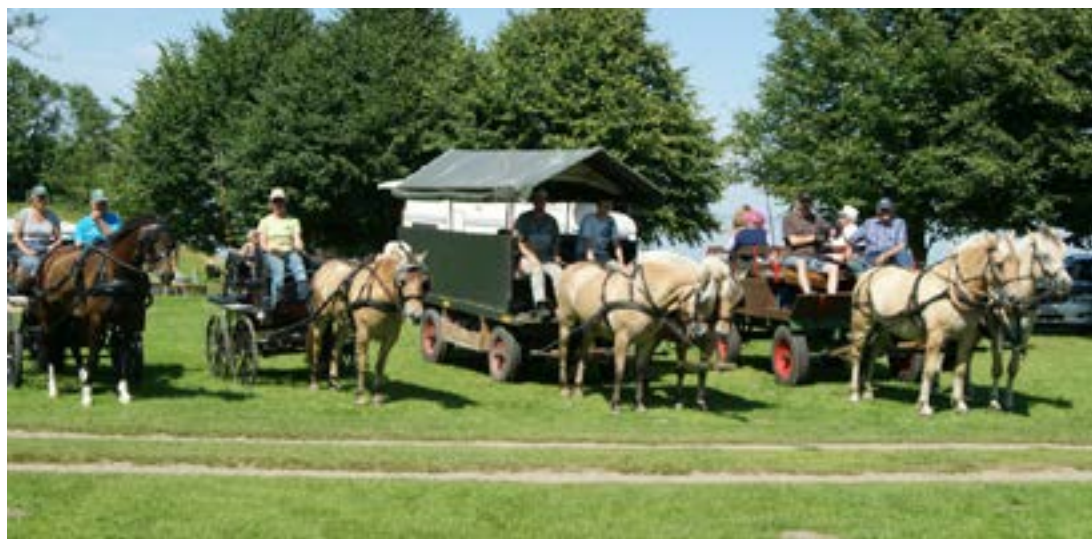
Så er vi klar i Stenkoppel

Onsdag morgen pakkede vi telte sammen og satte kursen mod Stenkobbøl, som vi troede, skulle være turens næstsidste stop. Køreturen var ca. 20 km gennem skov og de idylliske småbyer Helved