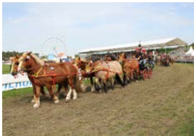
6-spand klar til maraton

Til åbningsceremonien blev der holdt mange taler, og til slut blev vi velsignet af den lokale præst, så var det ligesom også på plads.