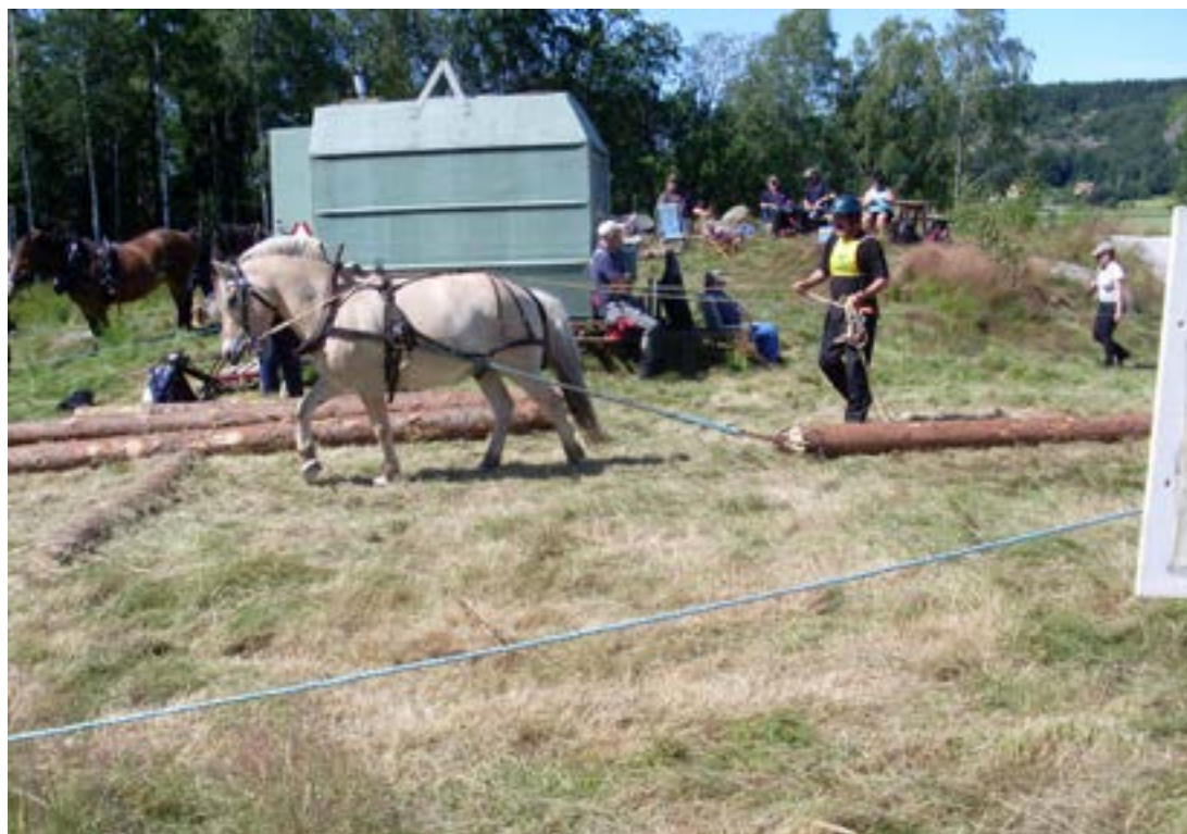
Flytning af enkelte stammer er også på programmet

Det har været en rigtig sjov oplevelse, og det er altid dejligt at mærke den gode stemning, når man arbejder med hestene på en anden måde. Det er en oplevelse, som jeg kan anbefale andre at prøve.