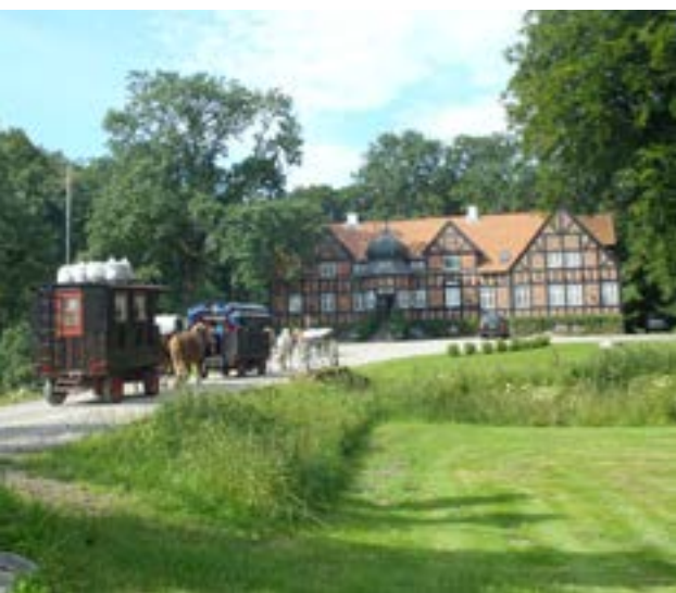
Passage af det smukke Wiffertsholm