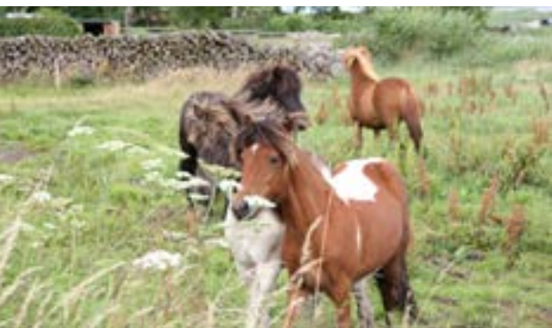
Man kan jo også nøjes med at se på, mens de andre kører forbi

Hver gang vi lægger en hånd på vore heste, udsætter vi den for noget, der er unaturligt. Hesten ville aldrig hoppe tyve gange en meter i naturen på få minutter, hvis den kunne slippe, eller løbe en maraton bare for sjov.