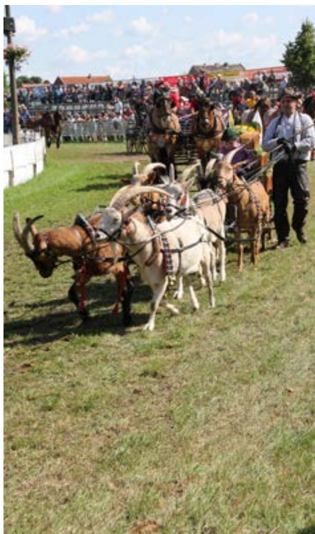
Man kan jo også spænde 6 geder for i mangel af bedre

Som I måske fornemmer, var det en fantastisk oplevelse at se dette show. Jeg kan varmt anbefale at tage turen forbi den sidste weekend i juni. Vær opmærksom på, at det er en god idé at have overnatning på plads hjemmefra, da der jo er 25.000 gæster i byen den weekend, og mange af dem overnatter i området, så man skal være i god tid. Næste år er temaet gamle kanonlavetter, så der bliver sikkert også rigeligt at se på.