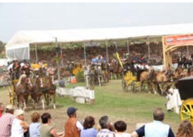
Postvogne der kørte kvadrille