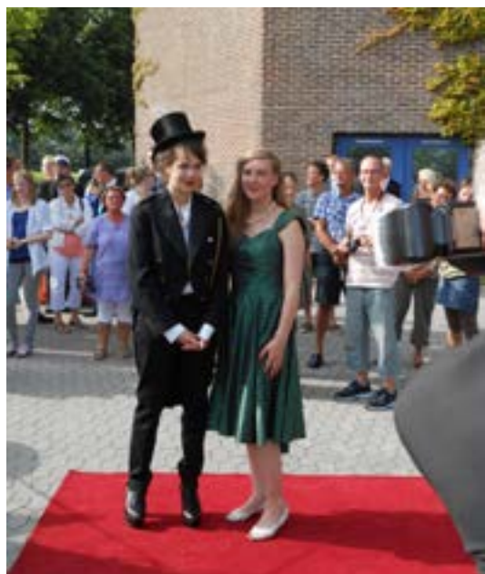
Ankomne studenter på den røde løber

Jeg var med til at pudse lygter og se efter, at der var nye stearinlys indsat.