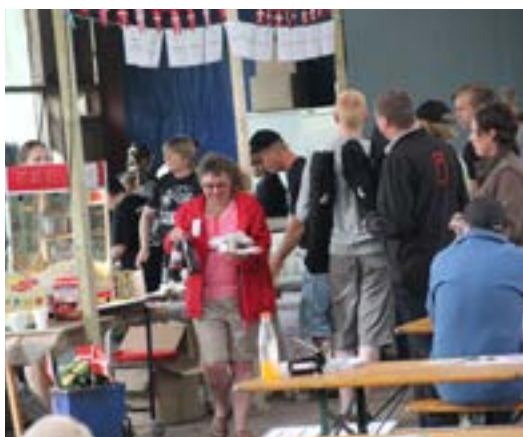
Køkkenpersonalet i fuld aktion

I løbet af dagen nåede vi da også til at skulle have sulten stillet. Det gjorde vi så i ridehallen, som var omdannet til et hyggeligt cafeteria. Heller ikke her blev jeg skuffet. Der var i den grad gang i den i det køkken, og det var ikke bare fastfood, der blev langet over disken. Det var god, gedigen dansk mad, som kunne mætte selv de mest sultne hestefolk. I køkkenet var der en dame,