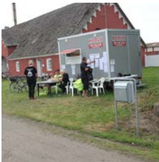
Information bemandet under hele stævnet

Så snart vi ankom til stævnepladsen på Holtegaard, var der hjælpere ifm. parkeringspladsen. Da jeg jo havde rekvireret pressekort, blev vi med det samme henvist til pressecentret, hvor pressekort lå klar til mig, selvom jeg havde bestilt meget sent. På min vej til "pressecentret" gik jeg forbi informationen, som også var bemandet hele weekenden.