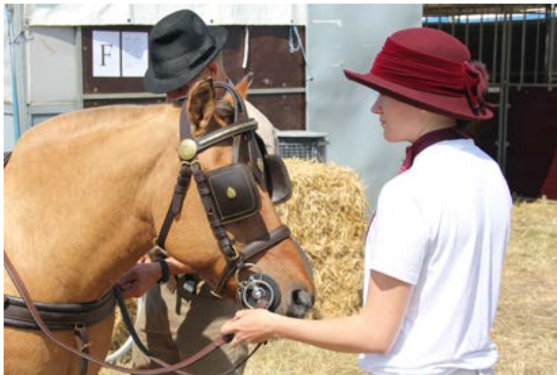
Klargøring til NM

Efter alle discipliner bliver hestens mund og bid set efter af en steward, og er der sår eller blod i munden tilkaldes stævnedyrlægen. Herefter vurderes, om hesten kan få lov til at starte næste disciplin. Det skal siges, at det sker relativt hyppigt, at en hest har en smule blod i munden f. eks. efter at have bidt sig i tungen/kinden især efter maraton etappen, men også efter dressuren. Det kan nu også være hændelige uheld, der gør, at de bider sig i munden. Er der sår i munden vurderes, om såret skyldes et tilfældigt bidsår, eller om biddet generer/gnaver hesten i munden.