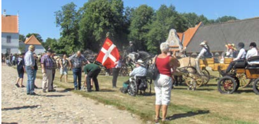
Præmieoverrækkelse på Nørre Vosborg