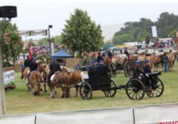
Opstilling til præsentation

Vi var spændte, da vi drog af sted mod Brück, og vore forventninger blev indfriet til fulde. Vi deltog i opvisningerne sammen med 16 andre hestetrukne kanoner fra forskellige århundreder og fra hele Europa. Derudover var vi med i åbningsceremonien, hvor ca. 70 spand heste (2-4-6-spand m.m.) kørte i ringen samtidigt. Det var en fuldstændig fantastisk og ubeskrivelig oplevelse at være en del af det, og det rislede ned af ryggen, da speakeren præsenterede os som "Vore venner fra Danmark", og publikum klappede os en omgang rundt. Jeg kan forestille mig, at det er på højde med at deltage i indmarchen ved De olympiske Lege.