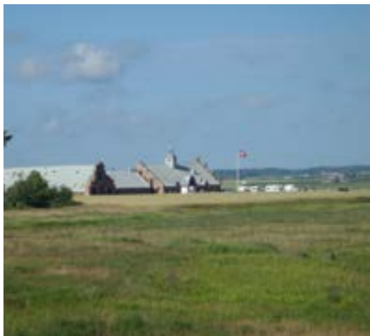
Egebaksande var base for turen

Thy Køreselskab bød kørefolket i hele landet på flotte naturoplevelser i Thy Nationalpark, krydret med historiens "vindsus" (det blæste gevaldigt de første dage) i læ af det forfaldne gods Egebaksande.