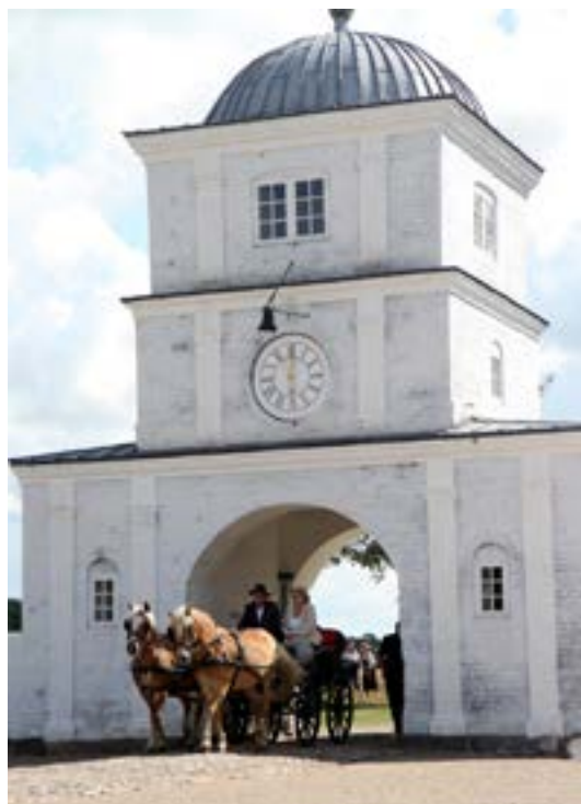
Med Nørre Vosborg som kulisse