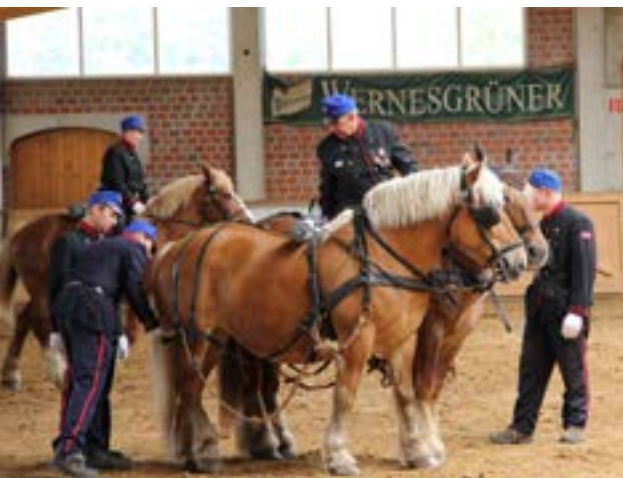
Klar til at spænde for

Inden vi kunne sige ja til den spændene invitation, var der mange overvejelser omkring det praktiske og økonomiske i at få kørt kanonlavet, seletøj, udstyr og syv heste til Brück. Dertil kom, at der skulle bruges 8-10 "soldater" til at bemandede kanonen.