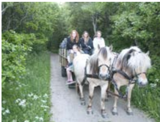
Silas og Erika for vogn