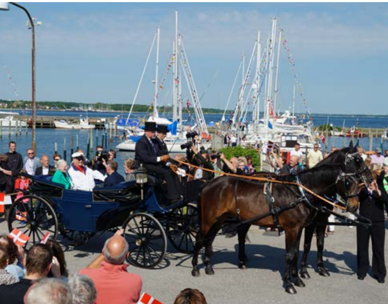
Der var mange tilskuere på havnen