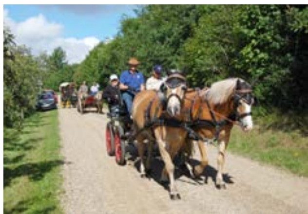
En dejlig tur ud i det blå