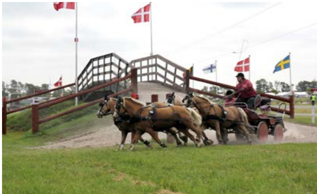
Eneste 4-spand til NM

Stævnet har velfortjent fået mange roser rundt omkring. Det var dog en overraskelse, at selv Ekstra Bladet var positiv i deres omtale med gode billeder. Så vidt vides dog kun på deres netavis, men alligevel, større kan det vel næsten ikke blive.