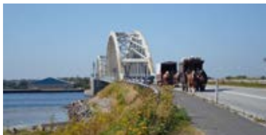
Det giver lidt kø over broen.