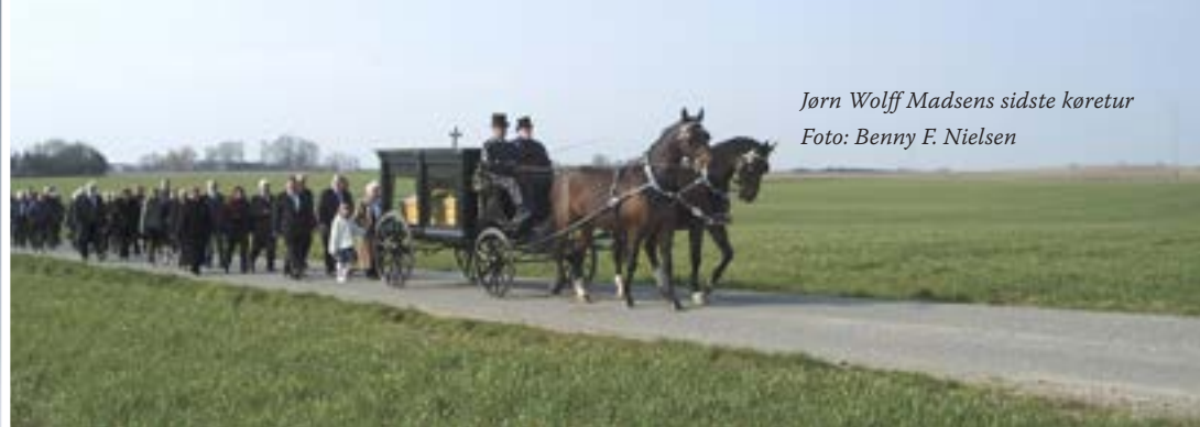
Jørn Wolff Madsens sidste køretur