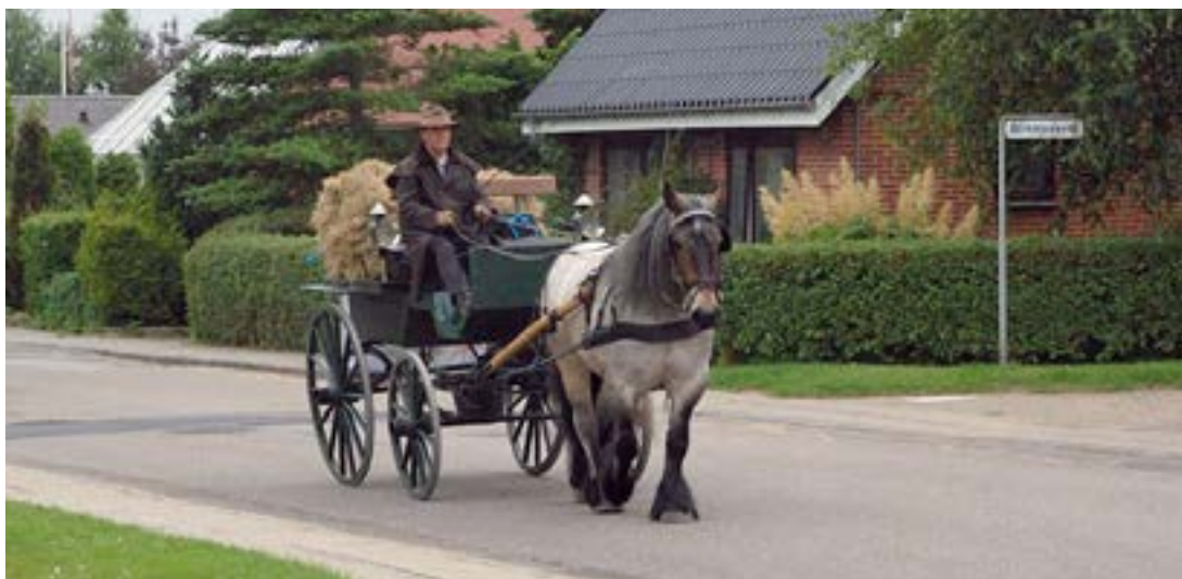
Martha på egen hov til landsskuet