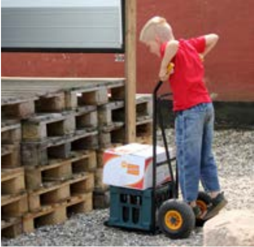
De har også sørget for at få fat i hjælpere i en ung alder