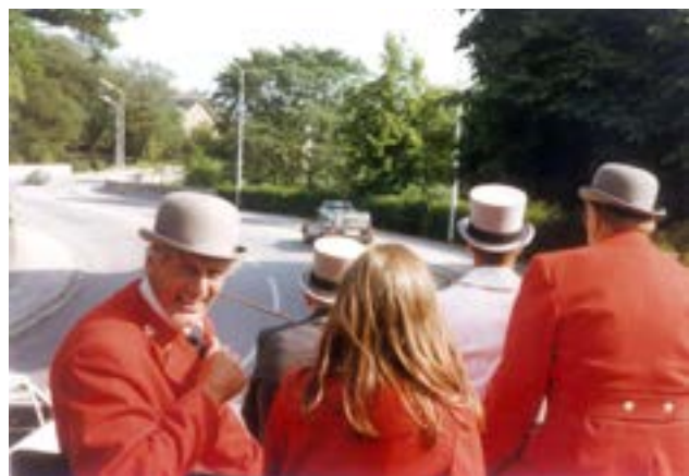
Med politieskorte gennem Nyborg