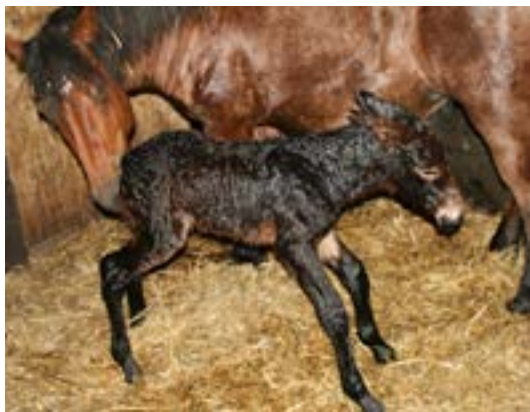
Et lille nyt muldyr

Det var selvfølgelig tre gode argumenter for at avle disse lidt pudsiges dyr. De har jo ører så store, så selv en elefant næsten kunne blive misunde-