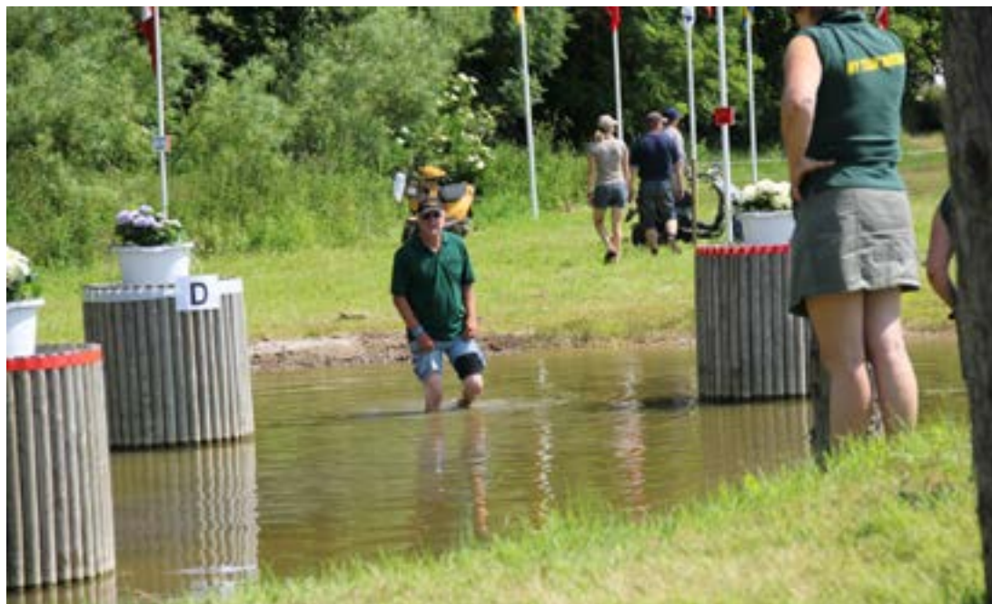
Dybden i vandgraven tjekkes