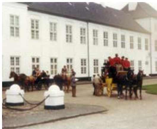
På tur i ØKS's område

komme ud. Den gik nok ikke i dag, hvor de har meget stramme tidsplaner for udkørsel af post, men det var på alle måder andre tider dengang.