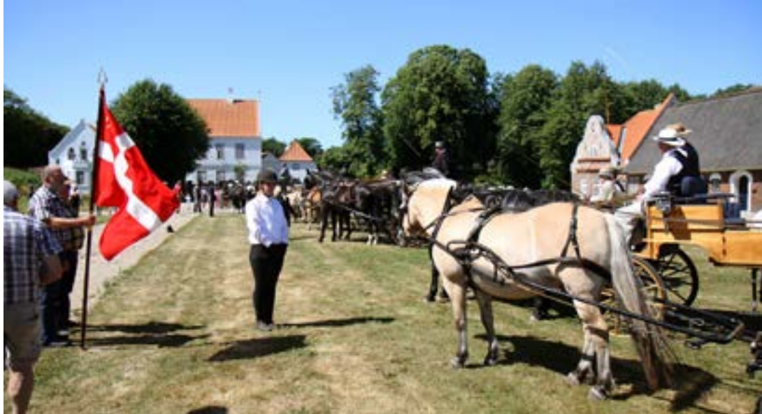
Så er der præmieoverrækkelse