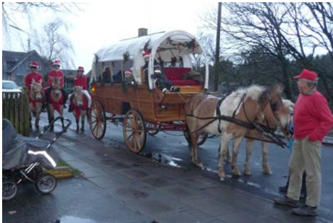
Flottere kan julemanden da ikke blive kørende