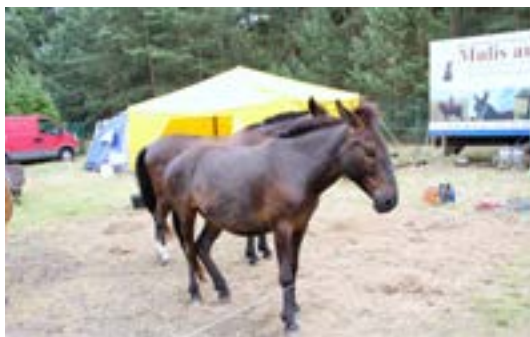
Man kan godt som muldyr få sig en lur, selvom man er til Titanen

Igen i år var min mand og jeg taget til Titanen der Rennbahn i Tyskland. Denne gang mødte jeg familien Rensch, som opdrætter muldyr. Muldyr er som bekendt en krydsning af en æselhingst og en hestehoppe (hos familien Rensch en koldblodshoppe). Muldyret er sterilt, og således kan man ikke avle på dem.