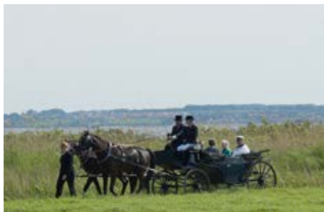
Med vandet som baggrund

Turen startede kl. 10.10 fra havnen med musik fra Slesvigske Musikkorps. Turen gik forbi en naturlegeplads med mange børn i dagens anledning, herefter ud til øens østligste punkt med udsigt til Årø Kalv (fuglereservat) og Assens.