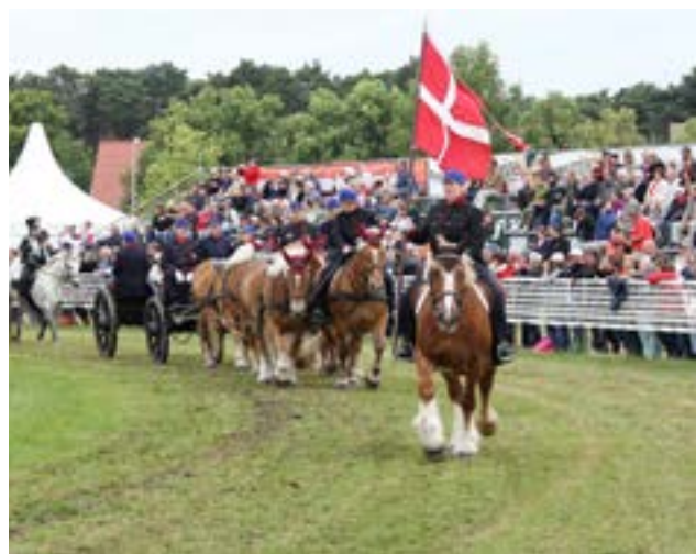
På vej ind foran de mange tusinde mennesker

Det største arbejde var dog at få de syv heste gjort klar. Vi har i familien seks heste tilsammen, men da en af dem ikke var i udstillingsform, og vi ud over 6-spandet gerne ville have en hest med til at gå forrest med fanen, måtte vi ud og skaffe to heste mere. Heldigvis kunne Stald Ramsdal hjælpe os med to gode, stabile, kørevante hopper. Så vi endte med syv røde hopper, tre af racen comtois og fire schleswigere. Alle heste blev samlet et sted, og træningen kunne begynde. Som det ses på billederne køres hestene á la d'Aumont, når man trækker en kanon. Det kræver træning at få samspillet mellem de tre kuske finpudset så meget, at hele 6-spandet kommer til at fremstå som en samlet ekvipage. Efter mange kilometers træning på de sønderjyske veje var både kuske og heste i form til at klare opgaven.