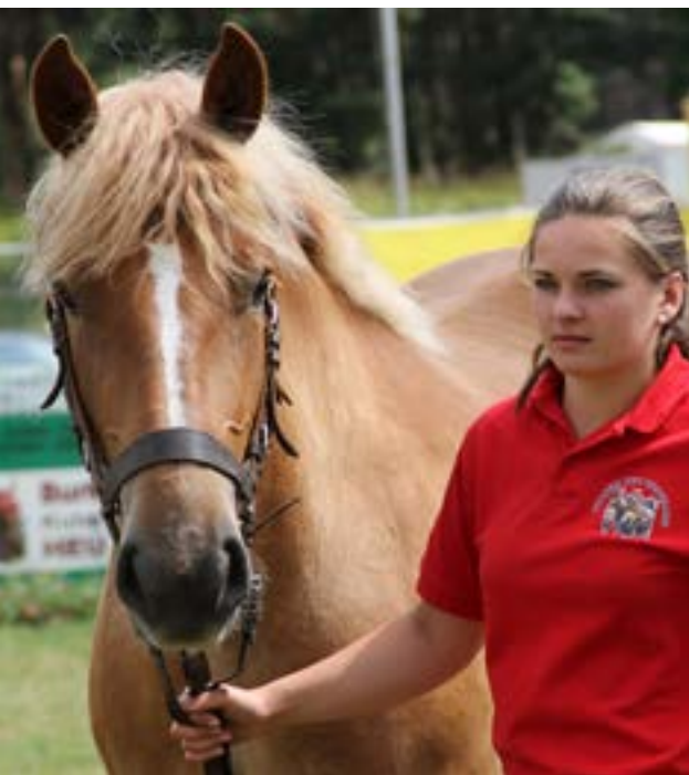
Fra følskuet ved Titanen der Rennbahn

I forbindelse med DKF's 40 års jubilæum har jeg samlet materiale fra 10 års jubilæets tur gennem Danmark. Jeg mangler dog den sidste tur over Sjælland, og håber, at nogle af jer, der var med, vil byde ind med billeder og beskrivelser.