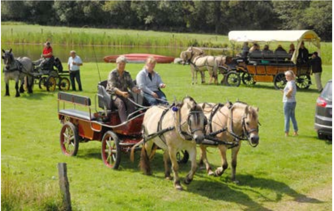
Pause ved søen