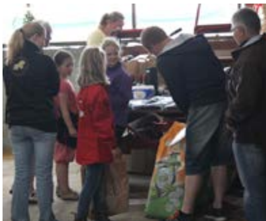
Lodseddelsalg til sponsorgaver

Derudover havde VK kontaktet en lokal foto-klub, som velvilligt var mødt frem til at bemande alle forhindringer med fotografer, så alle kuske kunne købe et USB-stik med fotos af sig selv. Der var også billeder både fra dressuren og keglekørslen. Rigtig godt initiativ.