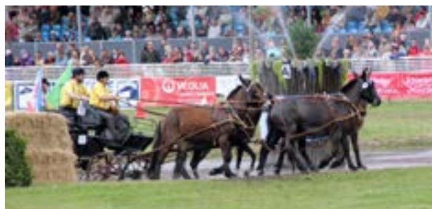
Muldyr kan også køre maraton

Vi så også muldyrene i funktion, således kørte de maraton og romervogn, og var bestemt på højde med de andre ekvipager af koldblodsheste.