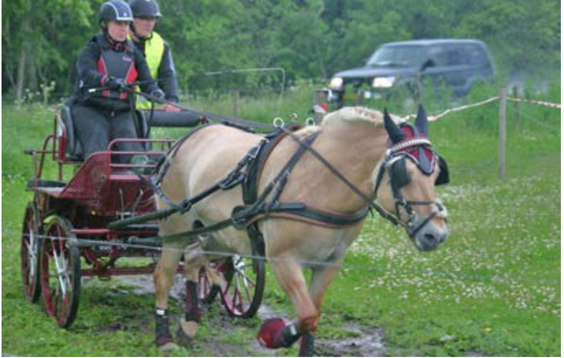
Pernille Prip fuldt koncentreret