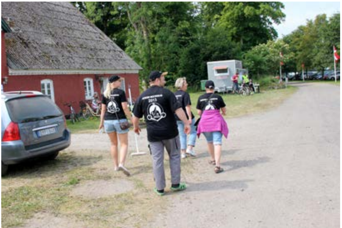
Man ser dem ofte kun med ryggen til, for de har travlt