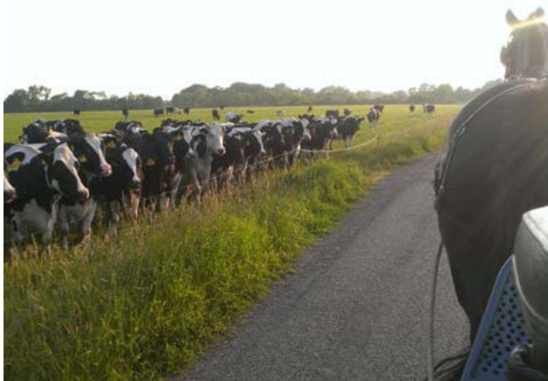
Det ser spændende ud med en hestevogn