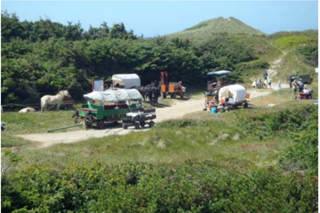
Pause ved Bøgstedrende