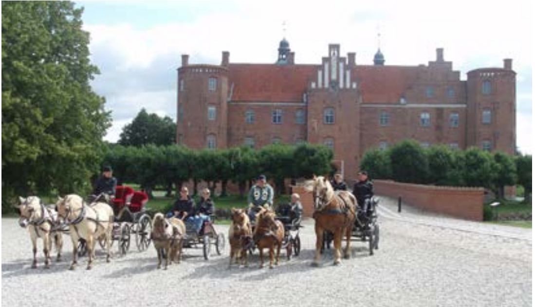
Til høst på Gl. Estrup