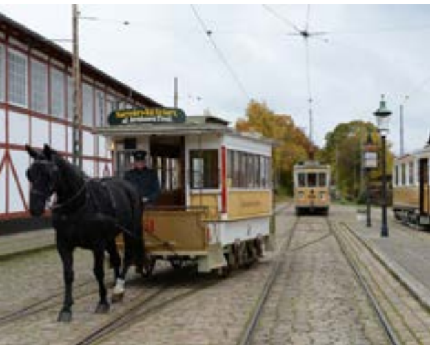
Klar til afgang