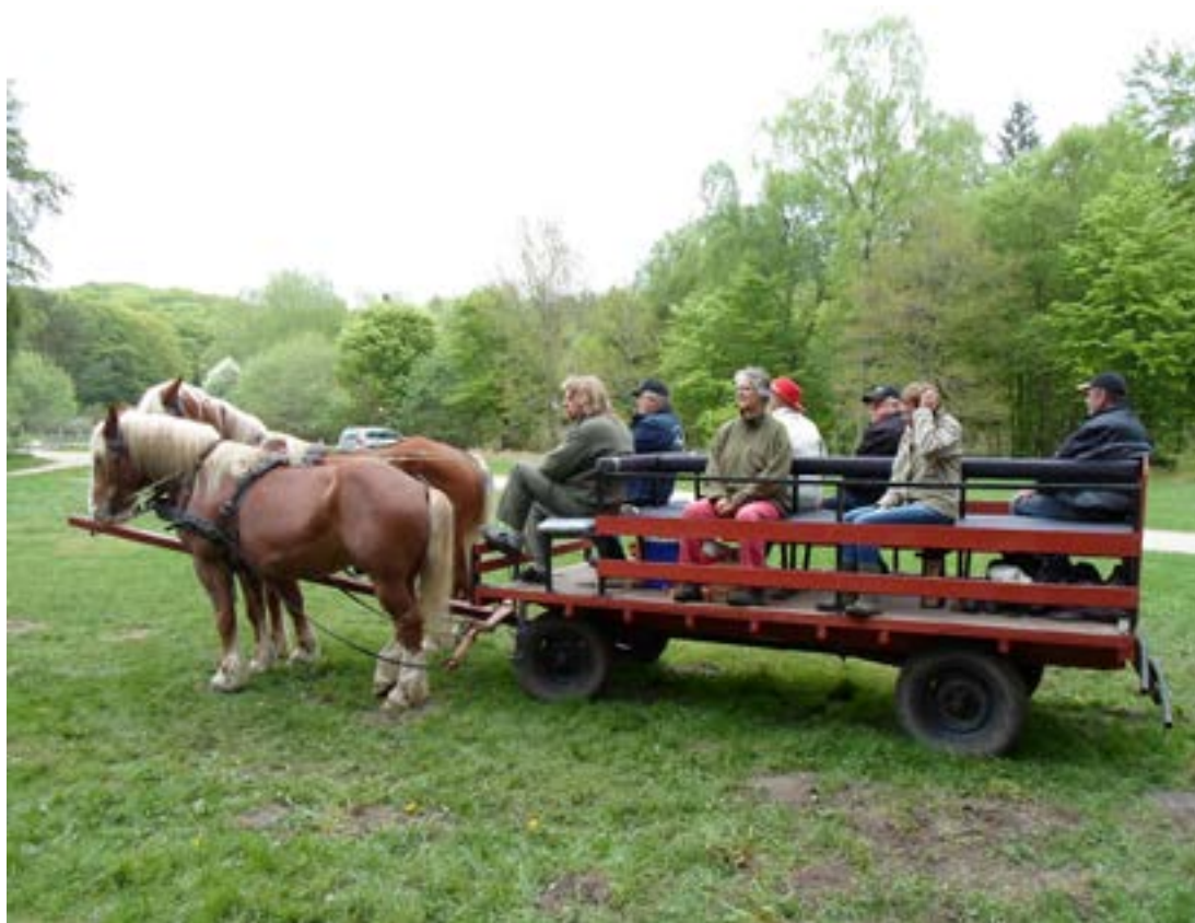
Norikerne er klar til at tage fat på forårsturen

Efter middagspausen gik turen igennem Rebild Skovhuse til den nordre del af Rold Skov, men det blev til en meget lille tur. Det sidste stykke gik gennem Rebild by til Skovbrugsmuseet, hvor vi sluttede af med en kop kaffe, en småkage og en lille en.