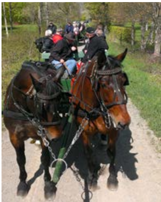
Bornholms Køreselskab på løvspringstur