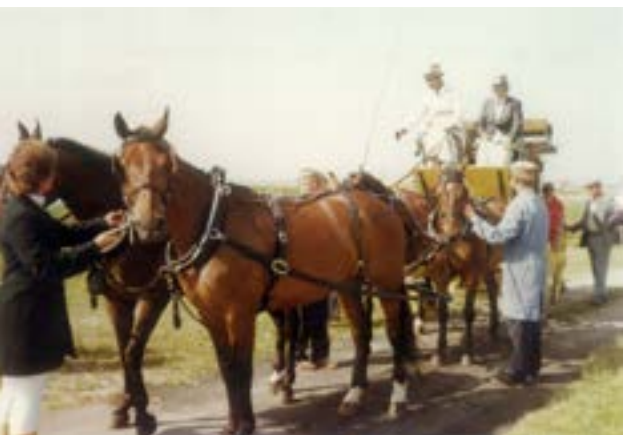
Så er det lige før postvognen starter fra Bøjden