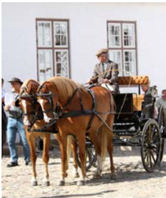
Til præsentationen

Søndag den 4. august 2013 meget tidligt om morgenen kørte vi fra Ribe med kurs mod Nørre Vosborg. Da ingen af os på forhånd vidste ret meget om den konkurrenceform, vi havde meldt os til, var vi i sagens natur spændte på, hvordan dagen ville forløbe.