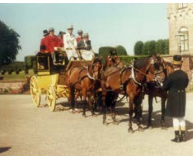
Postvognen ved Egeskov slot

Vagn Aksel hentede de fire heste ved 7-tiden, og vi kørte til Bøjden med ankomst 8.15. Lidt efter blev den ca. 100 år gl. postvogn på 1,5 t fra Henrik Haubro trukket i land af hjælpere.