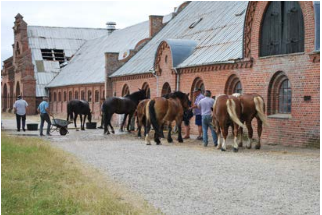
Kø ved vaskepladsen