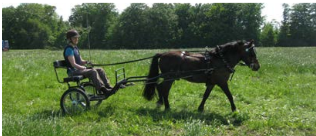
Mette klar til stævne

I den lange pause, skulle vi også gå forhindringerne igennem til maratonen.