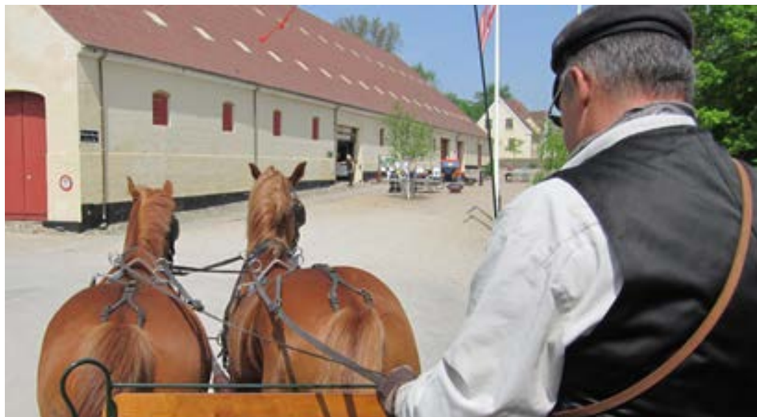
Kaperkusk på Egeskov Slot