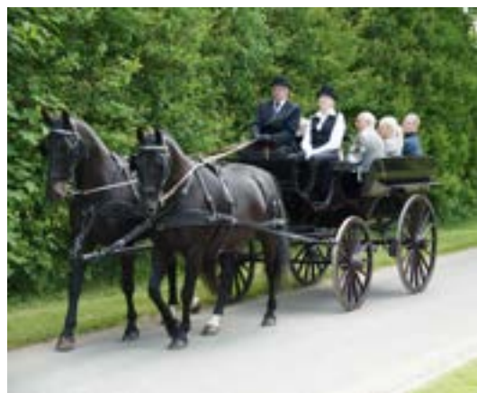
Svend Åge Nissen med følge