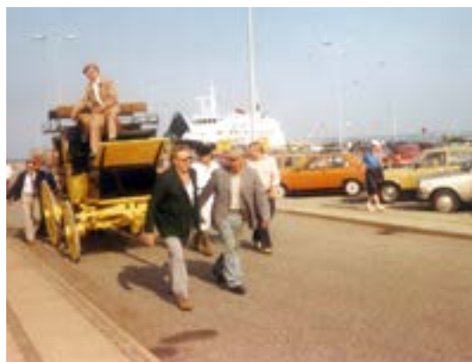
En anderledes forspænding