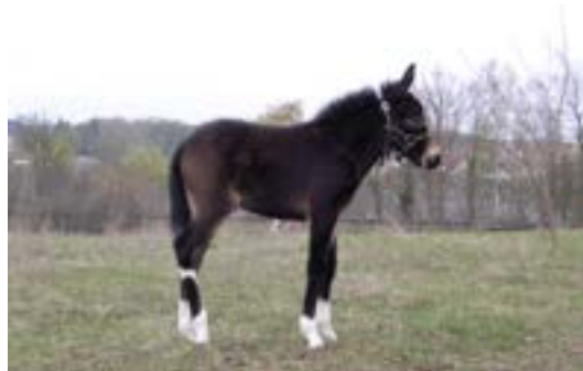
Så er man klar til fremvisning

lig. Ellers var det jo, som det kan ses på billedet meget rolige dyr. Dog skulle man lige vænne sig til deres skrig. De vrinsker ikke, de skriger, og det er særdeles højlydt, når de giver sig til kende. Men alt i alt meget rolige og venlige dyr.