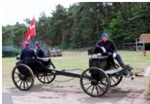
Kanonlavetten bygget efter gamle tegninger