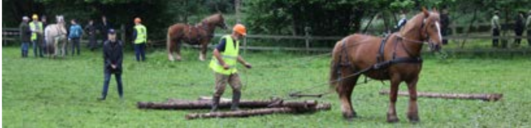
Der var også gang i tømmertrækningen