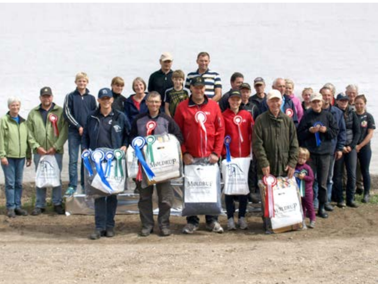
De glade vindere

Selvom vi havde sammenlagt klasserne både på tværs af dressurprogrammer og på tværs af hestestørrelser, var det meget tæt og fair konkurrence, og en enkelt placering blev i slutresultatet afgjort med 0,03 strafpoint.